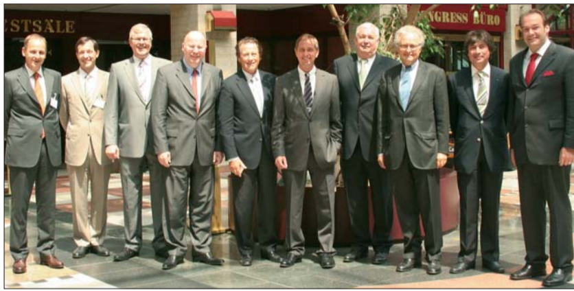
Der neue Vorstand des Verbandes der Deutschen Dental-Industrie e.V. (VDDI).