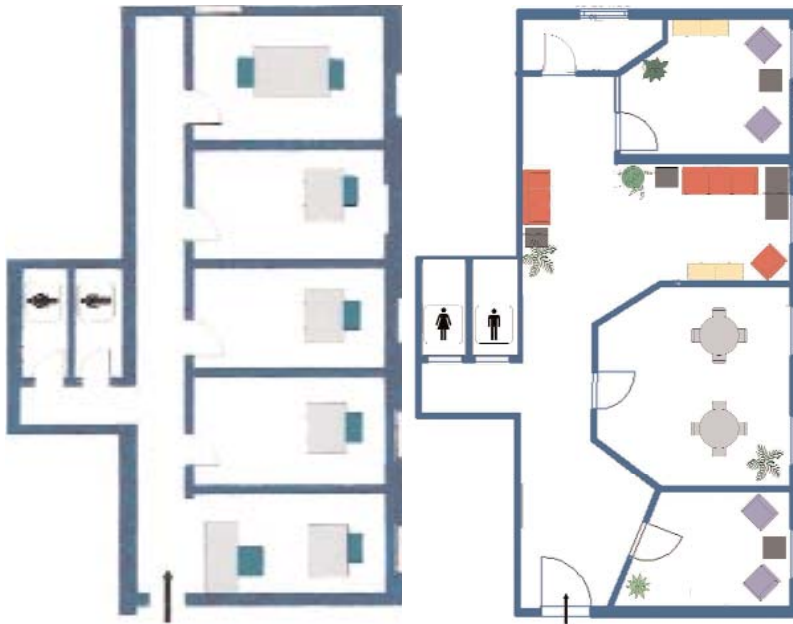
▲ Beispiel: Büroeinheit mit Schwerpunkt Besprechungen. Links: Grundriss Ursprungsplan. Rechts: Grundriss überarbeitet nach Feng Shui-Gesichtspunkten.

möglichst harmonisch fließen, weder zu schnell noch zu langsam. Ebenso wie die Akupunktur z. B. gestaute Energien in den Energiebahnen des Menschen wieder in Fluss bringt, so bringt Feng Shui die Energien der Räume wieder in Fluss.