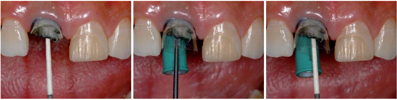
Abb. 10: Trocknung mit Papierspitzen. – Abb. 11: Anbringen einer Matrice und adhäsive Vorbehandlung der Stiftbohrung und der Restzahnhartsubstanz mit einem dualhärtenden, selbstätzenden Adhäsiv. – Abb. 12: Entfernung der Adhäsivüberschüsse mit einer Papierspitze.

wies eine gute Retention auf, weshalb versucht wurde, mittels Anwendung von Ultraschallenergie (Abb. 4) die Integrität des Zements zu zerstören, um den Stift ohne Gefahr für die Wurzel (cave: Längsfraktur) zu entfernen. Nach einiger Zeit lockerte sich der Stift und ließ sich problemlos aus der Wurzel entnehmen (Abb. 5). Nach Darstellung des durch den Metallstift stark erweiterten Wurzelkanaleingangs wurde die Länge der bereits vorhandenen Tiefenbohrung, ausgehend von einem koronalen Referenzpunkt, mit einem Wurzelkanalinstrument ermittelt, um nachfolgend mit dem Präzisionsbohrer des anzuwendenden Stiftsystems diese Strecke wieder einzuhalten.