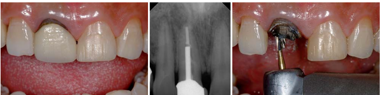
Abb. 1: Ausgangssituation: Ästhetisch unansehnliche Krone an Zahn 11. – Abb. 2: Das Röntgenbild zeigt einen endodontisch behandelten Zahn mit Metallstift. – Abb. 3: Zustand nach Abnahme der Metallkeramikkrone. Entfernung des Aufbaumaterials.

Die grundsätzlichen Anforderungen an Wurzelkanalstifte umfassen neben der guten Passgenauigkeit, der Biokompatibilität und der elektrochemischen Unbedenklichkeit unter anderem eine hohe Bruchfestigkeit, einen hohen Ermüdungswiderstand gegen Kau- und Scherbelastung und eine möglichst stressfreie Verteilung der einwirkenden Kräfte in der Zahnwurzel. Durch