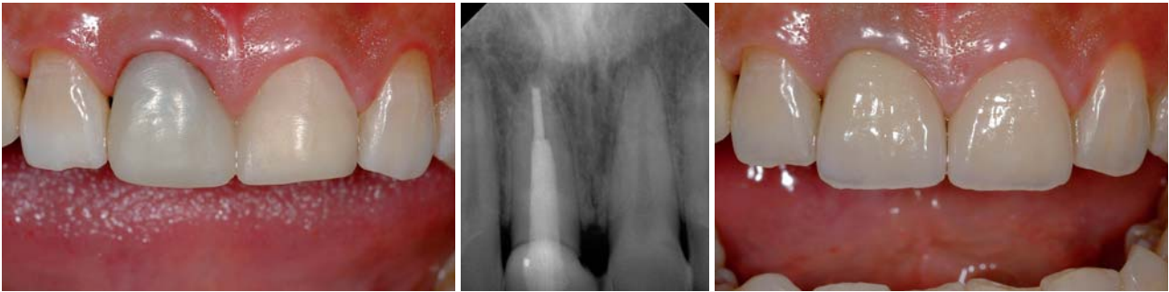
Abb. 16: Provisorische Versorgung. – Abb. 17: Röntgenkontrollaufnahme. – Abb. 18: Fertig restaurierte mittlere Schneidezähne im Oberkiefer.

mentschicht befinden und somit eine maximale Anhaftung an die Kanalwand mit Optimierung auch der Dichtigkeit resultiert. Der an der koronalen Öffnung der Stiftbohrung ausgetretene Zementüberschuss kann gleich als Teil der Aufbaufüllung verwendet werden. Nach Einbringen des Stiftes fand im gleichen Arbeitsgang mit derselben Applikationskanüle die Herstellung des koronalen Kompositaufbaus mit Rebuilda DC statt (Abb. 13). Anschließend wurde mit der Polymerisationslampe das Komposit für 40 Sekunden polymerisiert (Abb. 14) und nach Abnahme der Matrize der Zahn 11 sofort für die Aufnahme einer Zirkonoxidkeramikkrone präpariert (Abb. 15). Deutlich ist ein präparierter Dentinsaum unterhalb des Kompositaufbaus zu erkennen. Der im Idealfall allseits mindestens 2 mm breite Dentinsaum wird von der definitiven Krone ringförmig eingefasst. Dieser sogenannte Ferrule-Effekt stabilisiert die stiftversorgte Zahnwurzel und erhöht nachweislich die Festigkeit des restaurierten Systems. Der linke mittlere Schneidezahn wurde für ein Keramikveneer präpariert (Abb. 15). Nach der Abformung der Präparationen wurde ein Provisorium angefertigt (Abb. 16). Auf der Röntgenkontrollaufnahme ist der adhäsiv zementierte faserverstärkte Kompositstift deutlich zu erkennen (Abb. 17). Abbildung 18 zeigt die fertig restaurierten Zähne mit eingegliedertem Zirkonoxidkrone an Zahn 11 und adhäsiv befestigtem Keramikveneer an Zahn 21.