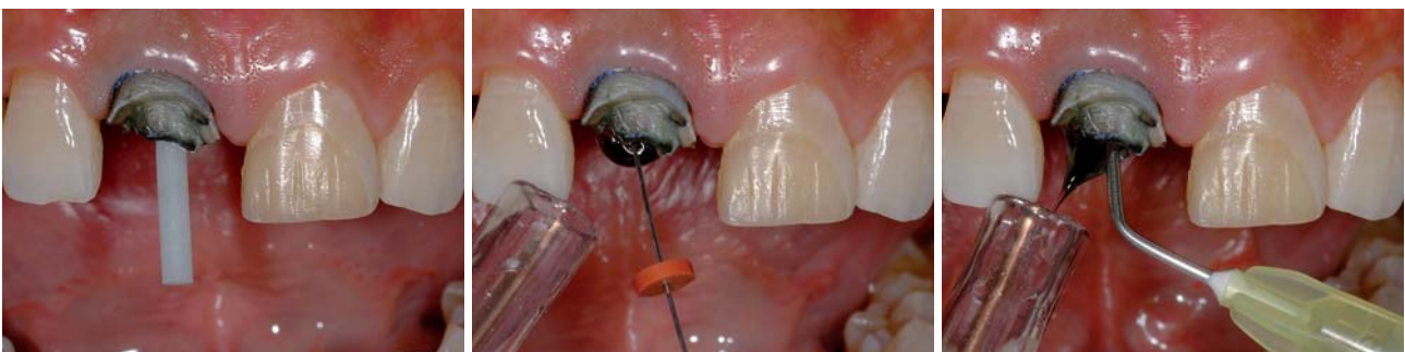
Abb. 7: Einprobe des Stifts aus glasfaserverstärktem Komposit. – Abb. 8: Spülung des Wurzelkanals mit NaOCl. – Abb. 9: Spülung des Wurzelkanals mit Wasser.

Die Qualität der faserverstärkten Kompositstifte, welche mittlerweile von einer großen Zahl unterschiedlicher Anbieter offeriert werden, ist sehr unterschiedlich. Sie wird bestimmt durch das Herstellungsverfahren, eine möglichst gleichmäßige Verteilung der Fasern in der organischen Matrix bei möglichst dichter Packung der Fasern, einen guten Verbund der Fasern mit der Matrix, einen hohen Polymerisationsgrad der organischen Komponente und eine homogene Stiftstruktur ohne Blasen und Einschlüsse. 3 Nach der Polymerisation werden die Rohlinge durch einen Fräsvorgang in ihre endgültige Form gebracht. Es existieren verschiedene Stiftgeometrien, die aufgrund unterschiedlicher Fräsbear-