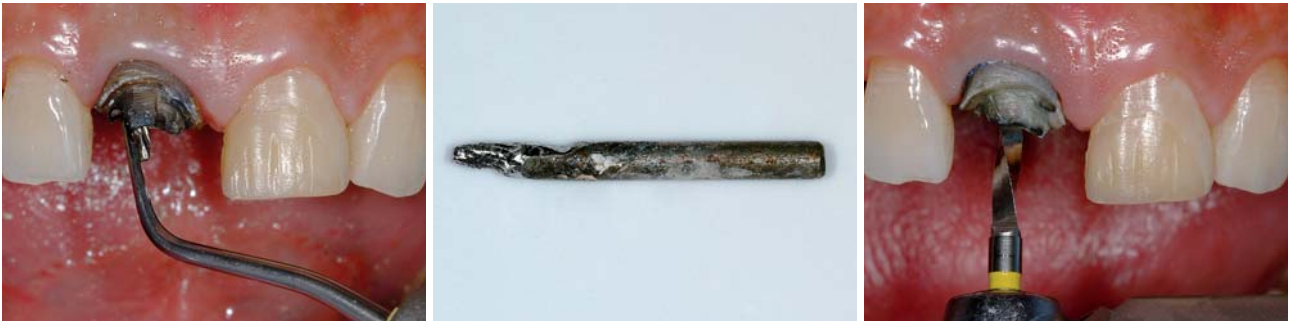
Abb. 4: Lockerung des Stifts mit Ultraschallenergie. – Abb. 5: Vorsichtig entnommener Metallstift. – Abb. 6: Aufbereitung des Stiftbetts mit einem längenmarkierten Normbohrer.

eine geeignete Stiftform soll die unnötige Schwächung der Zahnwurzel durch vermehrten Substanzverlust vermieden werden. 1