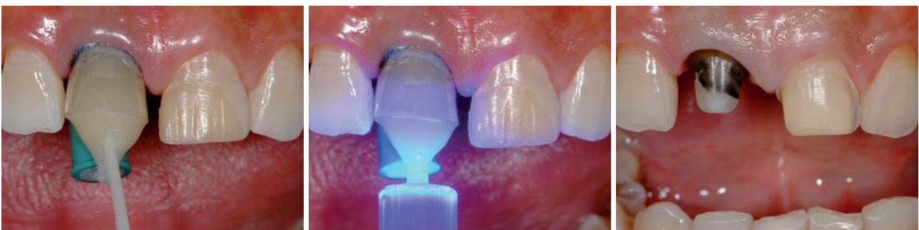
Abb. 13: Befestigung des Stiftes und Erstellung des Aufbaus mit einem dünn fließenden, dualhärtenden Aufbaukomposit. – Abb. 14: Lichtpolymerisation für 40 Sekunden. – Abb. 15: Fertiggestellte Präparation für eine Zirkonoxidkrone an Zahn 11 und ein Keramikveneer an Zahn 21.

Zur Sicherstellung der Form des Aufbaus wurde ein Matrizensystem am Zahn verankert. Das selbstätzende, dualhärtende Adhäsiv Futurabond DC (VOCO) wurde mit einem kleinen Endo-Microbrush in die komplette Stiftbettbohrung und auf die koronale Restzahnsubstanz für 20 Sekunden einmassiert (Abb. 11) und nachfolgend das Lösungsmittel mit ölfreier Druckluft evaporiert. Eine Papierspitze diente dazu, Adhäsivüberschüsse aus der Stiftbohrung zu entfernen (Abb. 12). Sofort im Anschluss wurde das dualhärtende, dünnfließende Stumpfaufbaukomposit Rebilda DC (VOCO) mit der QuickMix-Spritze mit dünnem Applikationsaufsatz in die Bohrung eingebracht. Die Spitze der Verlängerungskanüle wurde bis auf den tiefsten Punkt der Stiftbettbohrung in den Zahn eingebracht und unter langsamem Rückzug kontinuierlich Rebilda DC abgegeben, wobei darauf geachtet werden muss, dass sich die Auslassöffnung der Verlängerungskanüle immer im Befestigungskomposit befindet. Unmittelbar nach Befüllung des Wurzelkanals mit dünn fließendem Komposit wurde der Faserstift unter leichter Drehbewegung bis zum Endpunkt der Stiftbohrung eingeführt. Durch diese Art der „Tauchbefüllung“ ist sichergestellt, dass sich keine Luftblasen in der Ze-