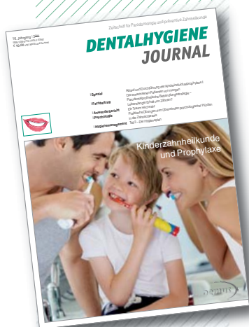
Titelbild mit Unterstützung von Procter & Gamble GmbH