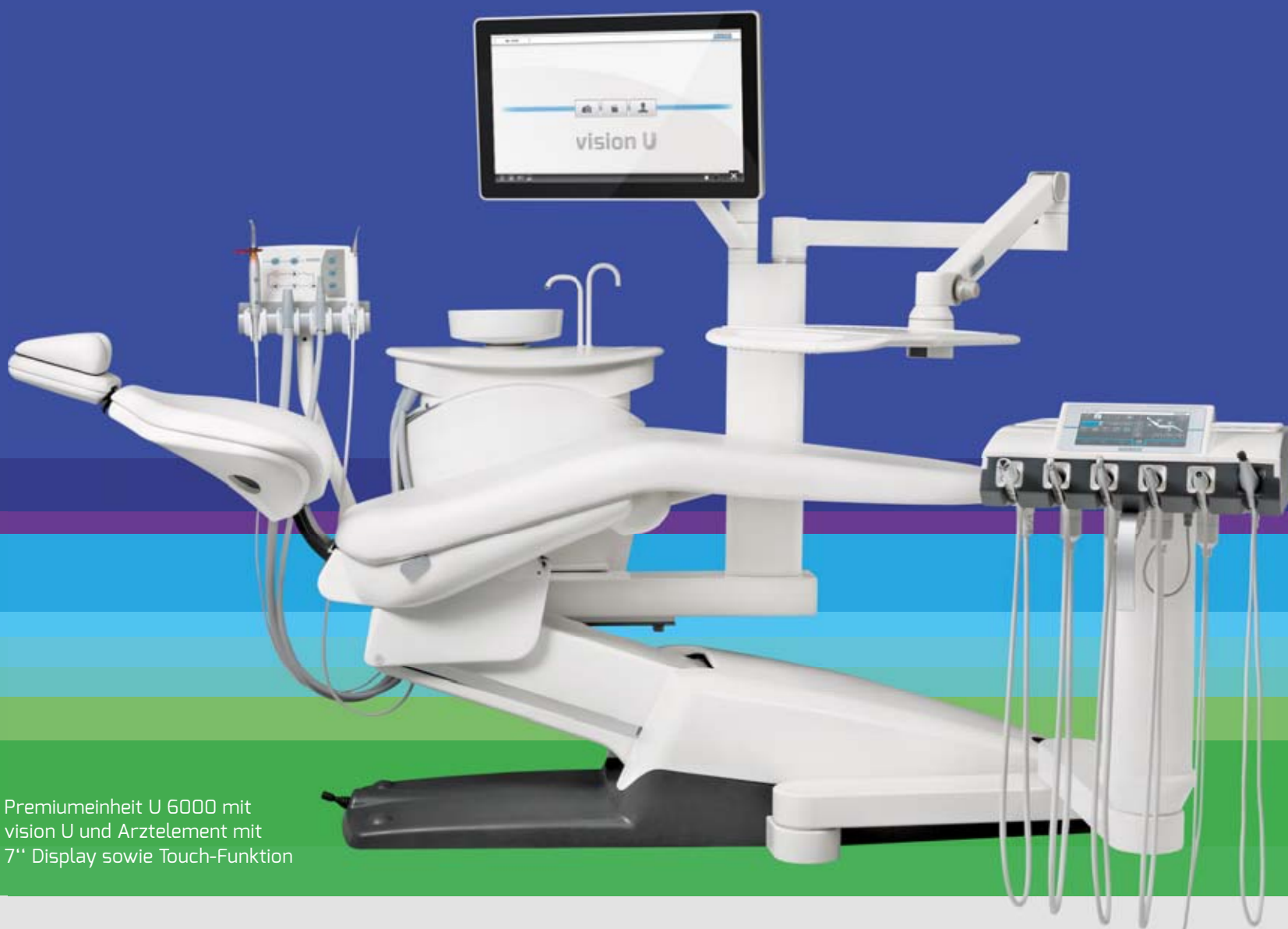
Premiereinheit U 6000 mit vision U und Arztelement mit 7" Display sowie Touch-Funktion

Intelligente Unterstützung Ihrer Qualitätssicherung? vision U!