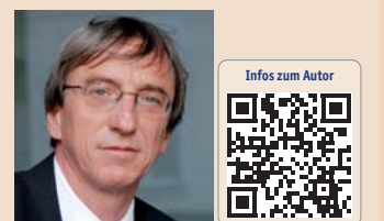
Infos zum Autor

Dr. med. dent. Behrouz Arefnia Medizinische Universität Graz Universitätsklinik für Zahn-, Mund- und Kieferheilkunde Klinische Abteilung für Zahnersatzkunde Auenbruggerplatz 12 8036 Graz, Österreich Tel.: +43 316 385-12535 Fax: +43 316 385-14064 behrouz.arefnia@medunigraz.at www.meduni-graz.at