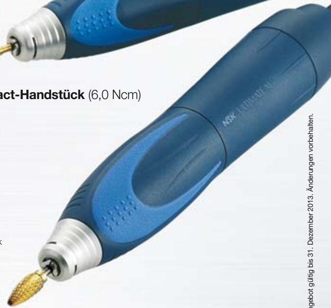
Torque-Handstück (8,7 Ncm)