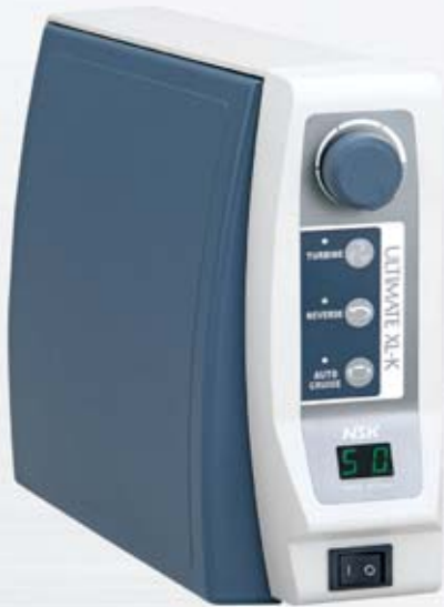
Kniesteuerggerät ULTIMATE XL-K