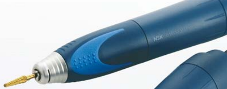
Compact-Handstück (6,0 Ncm)