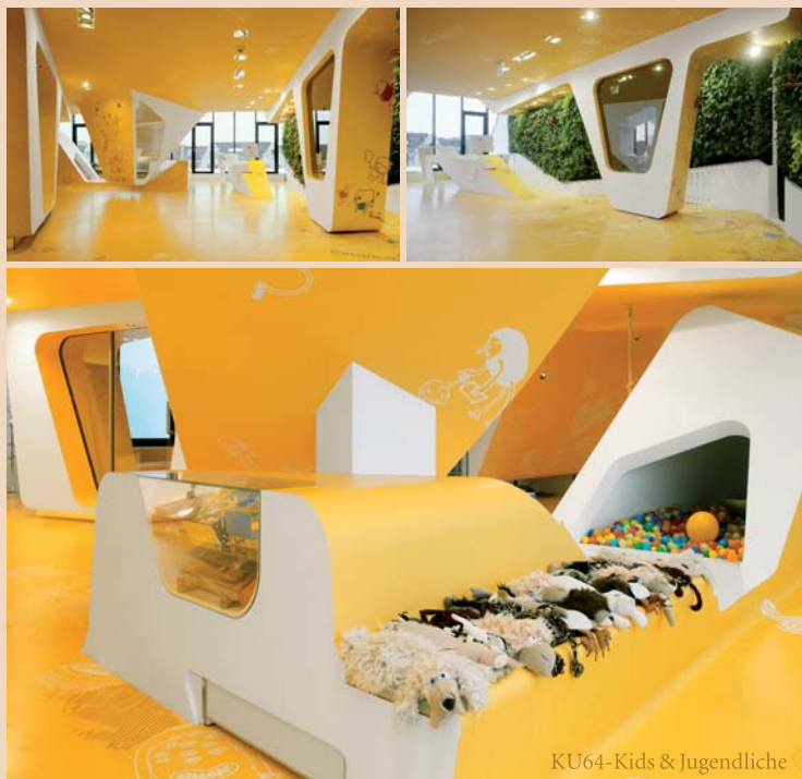
KU64-Kids & Jugendliche