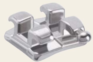
Micro Sprint® Brackets

Kaum zu übersehen – das derzeit kleinste Twin-Bracket der Welt in Originalgröße: das neue, konventionell ligierbare Micro Sprint® Bracket von FORESTADENT. Trotz seiner geringen Maße verfügt es über alle wesentlichen Merkmale, die Sie von einem modernen Bracket erwarten können. Es ist nickelfrei, mit allen gängigen Bogendimensionen kombinierbar und verfügt über die patentierte FORESTADENT Hakenbasis für optimale mechanische Retention. Trotz Low-Profile-Design ermöglicht es den Einsatz von Elastikketten. Alles vereint in einem einzigen, winzigen Stück hochfestem Edelstahl. Darum wurde Micro Sprint® auch als red dot design award winner 2013 ausgezeichnet. Was es noch kann, erfahren Sie hier: www.forestadent.com/microsprint .