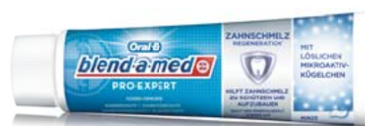
PRO-EXPERT Zahnschmelz Regeneration