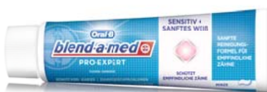
PRO-EXPERT Sensitiv + Sanftes Weiß