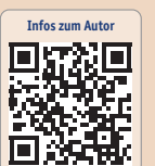
Infos zum Autor

Deshalb werben wir in den letzten Jahren dafür, diesen Begriff Kontraindikation durch den Terminus Indikationseinschränkung zu ersetzen, die unterschiedlich ausgeprägt sein kann. Niedrig ausgeprägt heisst, es kann sehr wohl implantiert werden, und mittel bzw. hoch ausgeprägt heisst, es kann unter bestimmten Bedingungen implantiert werden.