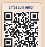
Infos zum Autor

Deshalb werben wir in den letzten Jahren dafür, diesen Begriff Kontraindikation durch den Terminus Indikationseinschränkung zu ersetzen, die unterschiedlich ausgeprägt sein kann. Niedrig ausgeprägt heisst, es kann sehr wohl implantiert werden, und mittel bzw. hoch ausgeprägt heisst, es kann unter bestimmten Bedingungen implantiert werden.