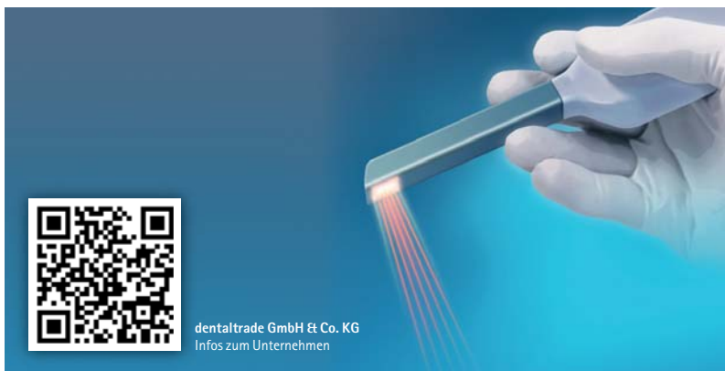
dentaltrade GmbH & Co. KG Infos zum Unternehmen

Mit dem Schwerpunktthema digitale Abdrucknahme präsentiert sich dentaltrade, der Bremer Anbieter von Zahnersatz aus internationaler Produktion, auf den relevanten Fachmessen im Herbst, unter anderem so am 19.10.2013 auf der id süd in München (Stand F05). Mit rund 4.000 Kunden zählt dentaltrade zu den führenden