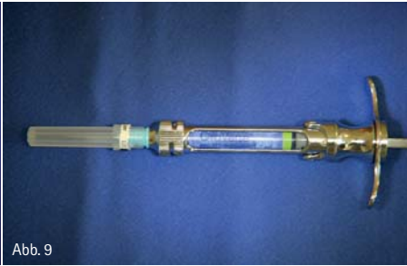
Abb. 1: Vollständige Sanierung bei einem Geschäftsmann. – Abb. 2: Zustand nach endodontischer Revision 15, 17. – Abb. 3: Zustand nach endodontischer Revision 45. – Abb. 4: 15 bis 17, Zirkonoxidkronen auf dem Modell – Abb. 5: Vollkeramische Restauration 44 bis 47. – Abb. 6: Sicht auf den vierten Quadranten mit Präparation für Zirkonoxidkronen an 45/46 und IPS e.max 3/4-Kronen an 44/47. – Abb. 7: Ansicht nach Eingliederung der Restauration. – Abb. 8: Vorbereitung der OraVerse-Injektion:10er-Einheit. – Abb. 9: OraVerse bereit zur Applikation mit der gleichen Zylinderampullenspritze wie für die Lokalanästhesie.