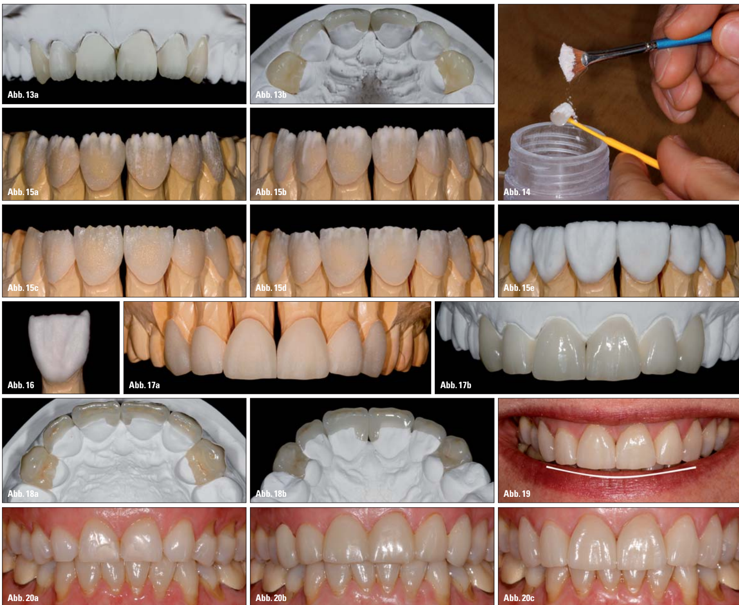
Abb. 13a–b: Die aufgepassten und ausgearbeiteten Veneers und Teilkronen auf dem Kontrollmodell. – Abb. 14: Aufstreuen der Dentinmasse für den Washbrand. – Abb. 15a–e: Ablauf der Schichtung. – Abb. 16: Da die mesialen und distalen Ecken beim Brennen erfahrungsgemäß am meisten schrumpfen, werden diese in Form von kleinen „Hörnchen“ verstärkt aufgebaut. So spart man sich einen extra Brand, nur um die Ecken anzutragen. – Abb. 17a–b: Die Veneers und Teilkronen nach dem Ausarbeiten und nach dem Glanzbrand. Das Finish erfolgt durch die Politur von Hand. – Abb. 18a–b: Die fertige Arbeit auf dem Kontrollmodell von okklusal und palatinal. Kleine Abrasionsflächen schaffen eine natürliche Wirkung. – Abb. 19: Nach dem Einsetzen: Der Verlauf der Oberkieferfrontzahnlangen folgt dem Verlauf der Unterlippe. – Abb. 20a–c: Behandlungsverlauf von oben nach unten, Ausgangssituation, Provisorium und die fertige Arbeit zwei Monate nach dem Einsetzen.