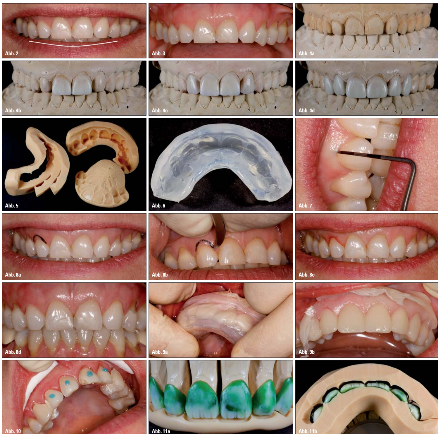
Abb. 2: Die Längen der Oberkieferfrontzähne folgen nicht dem Verlauf der Unterkieferlippe, durch die starke Abrasion ging die natürliche „Smileline“ verloren. – Abb. 3: Umgekehrte „Smileline“ der Oberkieferfront. – Abb. 4a-d: Situationsmodell (4a) und Anfertigung des Wax-ups. – Abb. 5: Silikon-schlüssel als Präparationshilfen. – Abb. 6: Silikon-schlüssel aus klarem Silikon zur Herstellung des Provisoriums. – Abb. 7: Messen der Sulkustiefe. – Abb. 8a-d: Behandlungsablauf der Gingivektomie und das Ergebnis nach drei Tagen im Bild unten rechts. – Abb. 9a-b: Herstellung des Provisoriums. – Abb. 10: Punktuell Anätzen der präparierten Zahnoberfläche zum Einsetzen des Provisoriums. – Abb. 11a-b: Platzkontrolle der Modellation mithilfe der Präparationshilfen.

Nach der Abformung mit Aquasil Ultra erfolgten Modellherstellung und Modellation der Veneers direkt mit einem Cut-back in Wachs (Abb. 11a-b). Das Anstiften und Pressen der e.max-Schalen erfolgte in gewohnter Weise. Zum Pressen verwenden wir den Vario-Press 300e von Zubler. Die bei e.max übliche Reaktionsschicht ist hier so dünn, dass sie einfach abgestrahlt werden kann. Die Pressobjekte müssen nicht abgäuert werden und man erhält einen optimalen Randschluss, da die Ränder nicht „rund geätzt“ werden (Abb. 12). Die 4er wurden in HT A3 gepresst und die Front in HT A2 (Abb. 13a-b). Nach dem Aufpassen und Ausarbeiten erfolgte der Washbrand. Hierfür verwenden wir die Glaze Paste Fluo von Ivoclar. Dieses Glasurpulver wird gleichmäßig dünn aufgetragen und die Käppchen können mit den e.max Ceram-Malfarben zusätzlich charakterisiert werden. Danach wird mit einem trockenen Pinsel Dentinmasse in der entsprechenden Zahnfarbe aufgestreut, der Überschuss vorsichtig abgeklopft und der Rest mit dem Mund abgeputzt (Abb. 14). Als Hilfsmittel zum Aufsetzen der Veneers auf den Brenngutträger ist der flüssige Brenngutträger anax-fix blue ein optimales Hilfsmittel. Dieser wird direkt in das Veneer