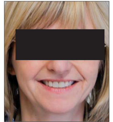
Abb. 21: Patientin vor der Behandlung und nach dem Einsetzen der Arbeit.

frontzahnlangen dem Verlauf der Unterlippe beim Lachen folgen (Abb. 19), konnte voll erfüllt werden. Die 1er wurden deutlich verlängert. Die 3er wurden vollständig in die Form von 2er gebracht. Hierzu wurde bei der Präparation vor allem von vestibulär reduziert, da die natürlichen 3er in diesem Bereich bedeutend bruchiger sind als die anderen Frontzähne. Die 4er sind nur von okklusal als solche zu erkennen. Von frontal sehen sie nun eindeutig wie Eckzähne aus und erfüllen auch durch die okklusal-palatinal Gestaltung voll und ganz ihre Funktion, bei den Lateralbewegungen alle anderen Zähne außer Kontakt zu stellen. Wir sind mit unserer „Zahnformgestaltung“ und dem ästhetischen Ergebnis sehr zufrieden. Die Vergleichsbilder Vorher-Provisorium-Nachher (Abb. 20a-c) zeigen noch einmal im Detail den Verlauf der Behandlung und das Ergebnis. Unsere Patientin hatte durch die Gestaltung des Provisoriums in der endgültigen Form und Länge in der zweiwöchigen Tragezeit die Möglichkeit, sich an das Endergebnis zu gewöhnen. Es spricht also für den Extraaufwand, ein Wax-up herzustellen und diese Situation dann über das Mock-up in den Mund zu übertragen (Abb. 21).