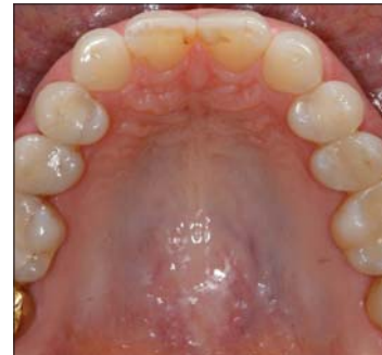
Abb. 1: Okklusalanlage des Oberkiefers vor der Behandlung, Nichtanlage der seitlichen Lateralen.

Frontzähne in die Behandlung einzubeziehen, wurden über das Wax-up verschiedene Silikon-schlüssel aus MATRIX Form als Präparationshilfe hergestellt (Abb. 5). Dieses additionsvernetzte Knetsilikon hat einen hohen Anteil an Silikonöl und erreicht hierdurch eine sehr hohe Zeichnungsschärfe. Aus MATRIX Flow 70 clear wurde ein Formteil zur Herstellung der temporären Versorgung angefertigt (Abb. 6). Des Weiteren bestand der Wunsch, eine kleine Zahnfleischkorrektur an Zahn 13 durchzuführen, um den Längenunterschied zu 23 etwas auszugleichen. Die Tiefe des äußeren Saumepithels betrug etwa 2mm und konnte somit bedenkenlos um etwa 1,5mm gekürzt werden (Abb. 7). Nach dem Anzeichnen wurde es einfach durch einen sauberen Skalpell-schnitt entfernt und zwei Tage