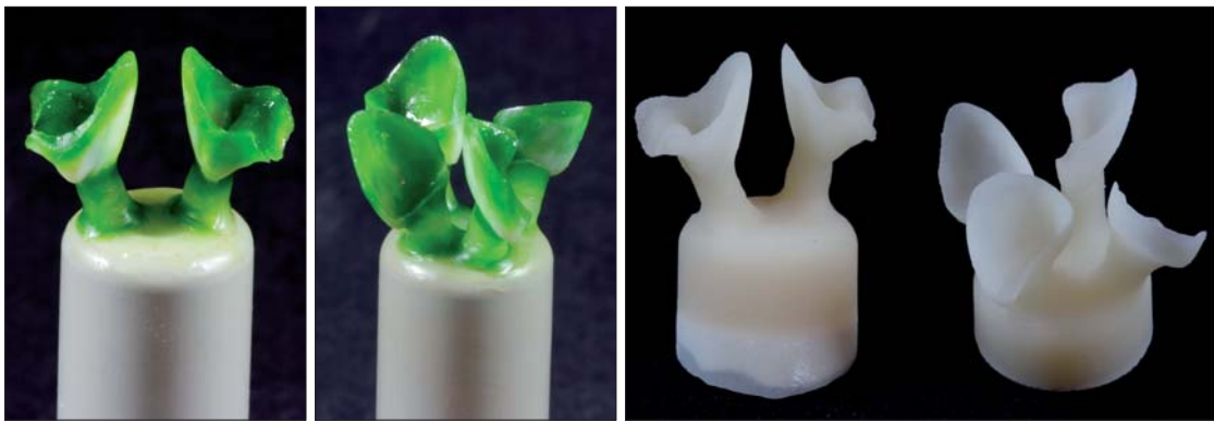
Abb. 12: Angestiftete Modellation und das Pressergebnis.

oder die Krone gespritzt und dann kann ein Zirkonpin eingedrückt werden. Anschließend kann das Ganze ein bis zwei Minuten im halb geschlossenen Keramikofen getrocknet werden. 400 °C Grundtemperatur sind hierfür ausreichend. Nach dem Abkühlen kann der Pin als Halter benutzt werden. Zum Brennen der Veneers haben wir uns allerdings für Brennwatte entschieden. Übrigens kann man die Kronen oder Veneers nach dem Aufstreuen der Keramik für den Washbrand ohne Probleme, am besten approximal, vorsichtig mit den Fingern anfassen und auf den Brennträger setzen. Zum Nachvollziehen des Schichtens werden die Farben der verwendeten Keramikmassen anhand ihrer Farbe und Eigenschaft beschrieben und im Anschluss wird die Originalbezeichnung der e.max Ceram-Massen in Klammern aufgeführt.