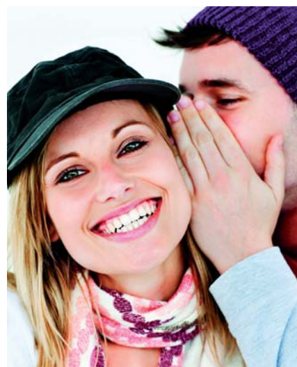
Ein schönes Lächeln ist ein kostbares Gut: Es macht unbefangen und selbstsicher, im beruflichen wie im privaten Bereich.

Patienten schätzen ihren Zahnarzt als kompetenten Berater, und solche Patienten, die auf ein natürlich gesundes Erscheinungsbild Wert legen, werden ihrem Zahnarzt auch zum Thema Zahnaufhellung ihr Vertrauen schenken. Wird der Blick der Patienten auf die Zahnaufhellung als ergänzende Maßnahme zu einer ganzheitlichen und sichtbaren Zahngesundheit geschärft, fördert dies auch ihr generelles Bewusstsein für gesunde Zähne und damit die Bereitschaft, regelmäßig etwas dafür zu tun. Eine intensive und kompetente Beratung über