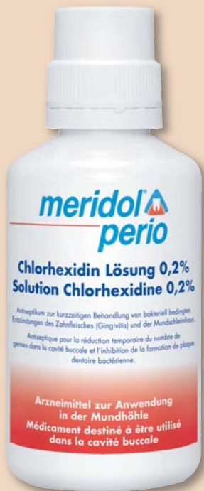
CHX-Mundspülung wieder im Handel.

Zur Abrundung der Behandlung während einer CHX-Therapie ist eine Zahnpasta ideal, die kein Natriumlaurylsulfat (SLS) enthält und somit die Wirkung des Chlorhexidins nicht beeinträchtigt (z.B. meridol® Zahnpasta). Nach Beendigung der Therapie sollte für die Langzeitanwendung ein System aus Zahnpasta, Zahnbürste und Mundspülung zum