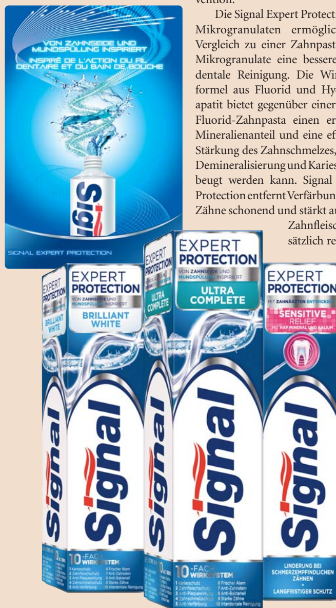
Die Signal Expert Protection wurde in Zusammenarbeit mit Zahnärzten entwickelt.

Tel.: +41 52 645 29 29 www.signal-net.ch