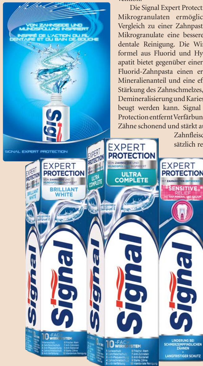
Die Signal Expert Protection wurde in Zusammenarbeit mit Zahnärzten entwickelt.

Tel.: +41 52 645 29 29 www.signal-net.ch