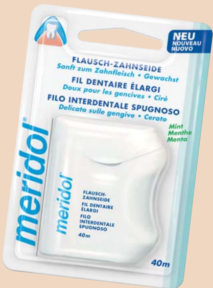
meridol Flausch-Zahnseide für gereiztes Zahnfleisch.

ihren Patienten dieselbe ans Herz legen. Ein Grund für die zögerliche Akzeptanz dieses Ratschlags mag in der Tatsache begründet liegen, dass die Verwendung konventioneller Zahnseide bei bereits gereiztem Zahnfleisch unangenehm sein kann.