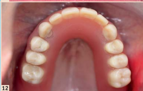
Abb. 7: Kontroll-OPG nach Implantatinserterion. – Abb. 8: Prothesenbasis mit Aussparungen für eine weiche Unterfütterung. – Abb. 9: Metallgehäuse MH-1 auf den Mini-Implantaten. – Abb. 10: Die grünen Distanzstücke sind sichtbar. – Abb. 11: Umgearbeitete Prothese. – Abb. 12: Oberkiefer-Totalprothese im Patientenmund.

umgearbeitet. Dies dient der exakten Übertragung der Planung in den Patientenmund.