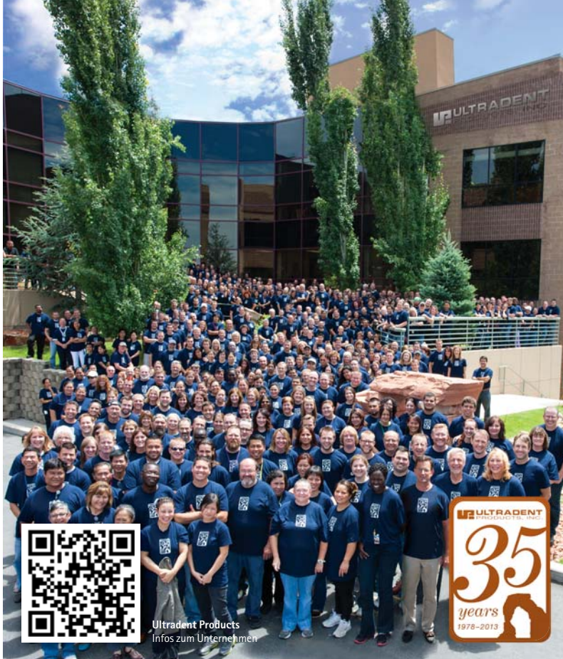
35 Jahre Firmenjubiläum.

Monate sollte er ebenso beharrlich wie seine Tochter in seinem Forschungslabor verbringen. Schließlich gelang ihm die Entwicklung eines Bleaching-Gels, das die von ihm angestrebte Viskosität besaß und somit die optimale Konsistenz, um in der ebenfalls von ihm entwickelten passgenauen Schiene zu haften.