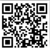
3Shape A/S – Infos zum Unternehmen

intraorales Scannen von Stiftaufbauten mit 3Shape TRIOS® sowie einzigartige Arbeitsabläufe bei der CAD-Konstruktion im Dental System™ 2013. Die Stiftaufbau-Lösung von 3Shape nutzt für eine zuverlässige Erfassung und optimal gestaltete und leistungsstarke Konstruktionen der Stiftaufbauten spezielle Scanfähigkeiten, sogenannte 3Shape Scan Posts™. Damit lassen sich Positionen und Tiefe der Stiftaufbau-Konstruktionen präzise erfassen; Scan Posts™ sind autoklavierbar und in verschiedenen Formen und Größen verfügbar, sodass Bohrsysteme von anderen großen Anbietern unterstützt werden. Darüber hinaus kann die Stiftaufbau-Lösung bei 3Shape TRIOS® digitalen Abdrücken und 3-D-Scans von Gipsmodellen verwendet werden. Die von Zahnärzten in Kliniken oder Praxen gemachten Eingaben können schnell und effizient zur unmittelbaren Konstruktion an das Labor gesendet werden. Dort können dann Stiftaufbauten für Standardkronen, einteilige zementierte Kronen sowie anatomische einteilige zementierte Kronen, die für die Verblendung reduziert wurden, konstruiert werden. Die CAD-Lösung von 3Shape ist in der erschienenen Software Dental System™ 2013 und mit 3Shape TRIOS® voll funktionsfähig.