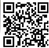
I-DENT Vertrieb Deutschland Infos zum Unternehmen

wird durch EverClear™ vermieden. Die Vorteile für den Behandler sind reduzierter Arbeitsstress, eine geringere Augenermüdung, eine deutliche Zeitersparnis, erhöhte Produktivität – und einfach mehr Spaß bei der Arbeit! EverClear™ begleitet sinnvoll jedes Präparationsset, das mit Kühlschpray eingesetzt wird – egal ob es sich hierbei um ein Schnellaufwinkelstück, ein Turbinenwinkelstück oder ein Ultraschallhandstück handelt. Er entspricht selbstverständlich den Hygieneanforderungen und kann, mit Ausnahme des Akkus, voll sterilisiert werden.