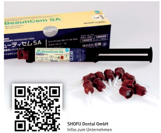
SHOFU Dental GmbH Infos zum Unternehmen

Porcelain Primer – empfohlen. Die bei diesen techniksensitiven Schritten maximal vereinfachte Anwendung erstreckt sich auch auf die Handhabung. Das Befestigungsmaterial wird in einer Doppelkammerspritze mit Automix-Aufsätzen angeboten, die eine gleichbleibende Anmischqualität – richtig dosiert und frei von Luft einschließen – garantieren. Der auf UDMA-Basis entwickelte Zement ist aufgrund der patentierten S-PRG-Füllkörper zur Fluoridabgabe und -aufnahme befähigt. Mittels dualadhäsiver Monomere wird ein fester Verbund zur Zahnschubstanz wie zu allen indirekten Restaurationsmaterialien und adhäsiv zu befestigenden Restaurationstypen garantiert. BeautiCem SA bildet dank seines thixotropen Fließverhaltens eine gleichmäßige blasenfreie Schicht von nur 11,8 µm aus; Überschüsse