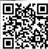
BIOMET 3i Deutschland GmbH Infos zum Unternehmen

Darüber hinaus erhöht das besondere Makrodesign des Implantats den initialen Knochen-zu-Implantat-Kontakt (IBIC). In präklinischen Studien konnte gezeigt werden, dass die 3i T3 Implantatoberfläche mit DCD® eine verbesserte Integration im Laufe der frühen Einheilphase befördert.