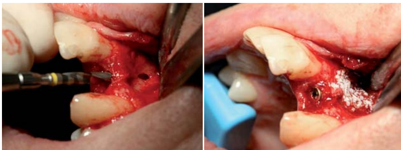
Abb. 2: Knochendefekt – simultaner Knochenaufbau nötig. – Abb. 3: Defekt via allogene Knochenchips bedeckt.

Im dritten Fall wird das Knochenersatzmaterial mit dem Ziel des Höhengewinns bei der Implantation um den aus dem vorhandenen Knochen herausschauenden Teil des Implantats eingebracht und anschließend abgedeckt.