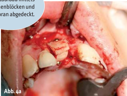
Abb. 4a, b: Defektaufbau mittels Knochenblöcken und Membran abgedeckt.

Weitere Indikation haben wir bei der präprothetischen Chirurgie, wenn großräumig der Alveolarkamm verbreitert und erhöht wird, manchmal auch unter Einbeziehung großer Knochenlamellen aus dem Beckenkamm des Patienten, oder bei größeren Wurzelspitzenentfernungen und Zystektomien sowie bei der Tumorentfernung.