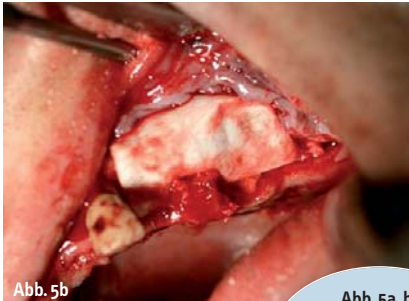
Abb. 5a, b: Vertikaler Knochenaufbau und Abdeckung mittels Membran.