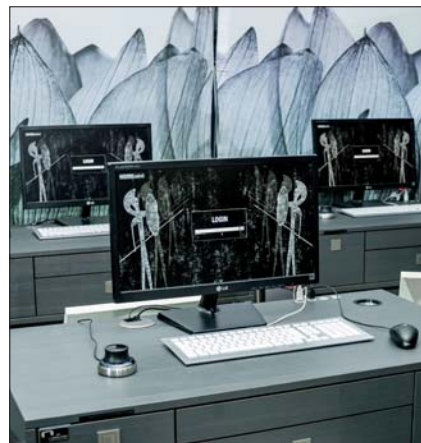
Das neue Mobile Labor.

Mitte der Molaren ein. Die Vielfältigkeit des Prettau® Zirkon demonstrierte der französische Zahntechniker Jean-Pierre Le Vot im zweiten Vortrag des Vormittages. Er stellte drei Patientenfälle mit Totalrehabilitationen auf Implantaten mit unterschiedlichen Konzeptionen vor: zementiert, verschraubt und teleskopiert. Beschrieben wurden die einzelnen Fertigungsschritte einer Prettau®-Brücke