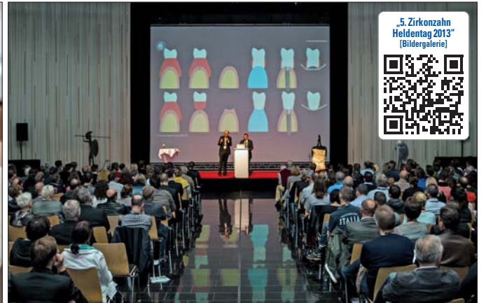
Mehr als 400 Teilnehmer besuchten die Veranstaltung.