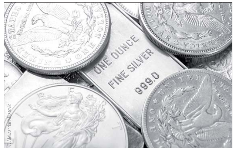
Der Silberpreis verläuft überproportional zu dem von Gold.