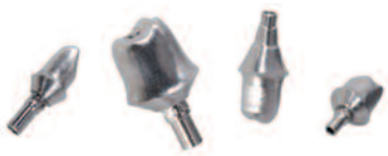
Individuelle Abutments für CAMLOG® aus der Fertigung von white digital dental.

white digital dental ist seit August Partner für die CAD/CAM-gestützte Fertigung von Abutments und Gingivaformern mit originalem Anschluss für die Systeme CAMLOG®, CONELOG® und iSy®. Die CAMLOG®-Abutments sind einteilig und werden aus Titan gefertigt. Sie ergänzen bei white das Portfolio von Implantatversorgungen mit Originalanschluss um eines der am stärksten verbreiteten Implantatsysteme auf dem deutschen Markt.