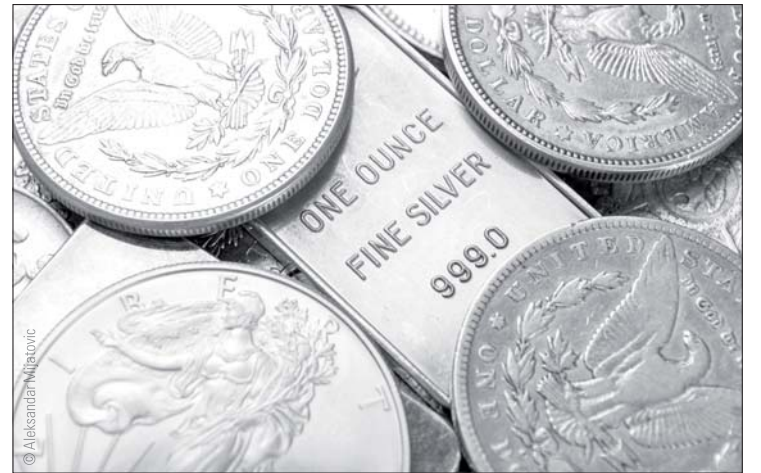
Der Silberpreis verläuft überproportional zu dem von Gold.

kleines Schlupfloch wird die sogenannte Differenzbesteuerung bieten. Silbermünzen und Münzbarren, welche von privat angekauft oder aus Nicht-EU-Ländern importiert werden, können dann, wie jetzt etwa schon im gewerblichen Gebrauchtwagenhandel üblich, differenzbesteuert werden. Hier muss der Händler lediglich den vollen Mehrwertsteuersatz auf seine Handelsmarge abführen. Alle großen Münzhändler, Banken und Edelmetallhändler bereiten ihre