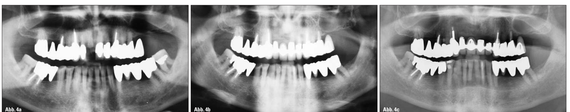
Abb. 4a: Panoramaschichtaufnahme 1989 (drei Jahre nach APT). – Abb. 4b: Panoramaschichtaufnahme 2005 (19 Jahre nach APT). – Abb. 4c: Panoramaschichtaufnahme 2012 (26 Jahre nach APT).

Die Zähne 34 bis 37 wurden durch eine Metallkeramikbrücke 1986 nach APT neu versorgt. Die Oberkieferfrontzähne 13 bis 22 erhielten Einzelzahnkronen. Der Zahn 26 wurde mittels eines Freindbrückengliedes in Prämolarenbreite an den verblockten Zähnen 23, 24 und 25 ersetzt, ebenso wie der fehlende Zahn 46 an Zahn 47. Die Lücke des Zahnes 16 wurde durch eine Metallkeramikbrücke an den Zähnen 14, 15 und 17 geschlossen. Im Jahr 1989 wurde der Zahn 11 mithilfe einer transdentalen Schraube alio loco nach Retentionsverlust der Krone fixiert und mit einer neuen Einzelzahnkrone versorgt (Abb. 5a). Im Jahr 1992 musste dieser Zahn aufgrund einer Wurzelfraktur entfernt werden, und es erfolgte 1993 eine erneute prothetische Versorgung der Oberkieferfront mittels einer Brücke von 22 und 21 auf 12 und 13. Der Zahn 22 wurde noch während der prothetischen Behandlungsphase wegen pulpitischer Beschwerden endodontisch behandelt. Die 1993 bzw. 1986 eingesetzten festsitzenden prothetischen Rekonstruktionen blieben bis zum bisher letzten Nachsorgetermin im März 2013 erhalten (Abb. 6b und c). Nach Entfernung des Zahnes 22 im Jahr 2012 wurde der Brückenanker 23 mit dem nun vorhandenen