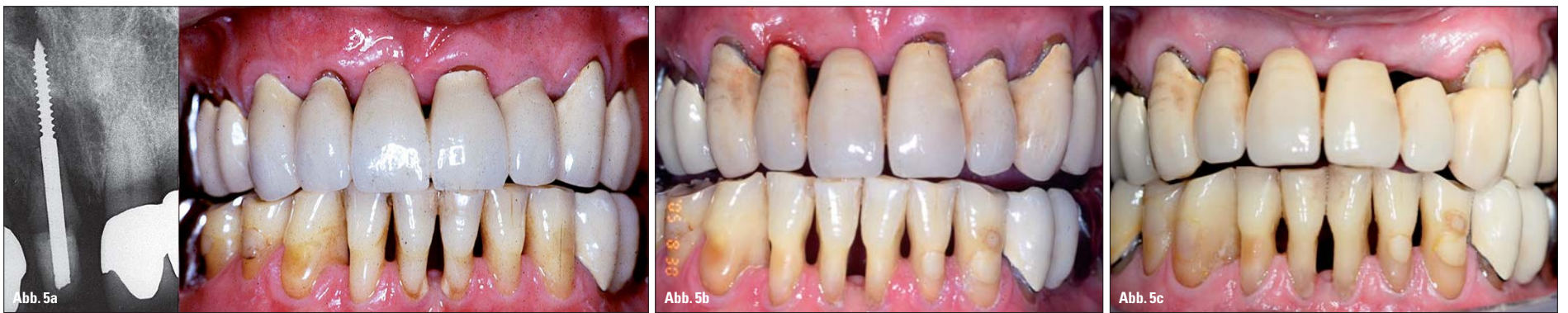
Abb. 5a: Einzelzahnfilm 1989 und intraorale Ansicht nach transdentaler Fixation 11 und neuer Einzelzahnkrone. – Abb. 5b: Intraorale Ansicht 2005. – Abb. 5c: Intraorale Ansicht 2012.

Brückenglied 22 mittels einer Slotpräparation und Einlage eines glasfaserverstärkten Bandes (Ribbond®, Seattle, US) von palatinal adhäsiv verblockt (Abb. 5c).