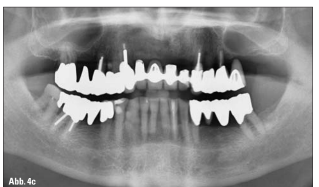
Abb. 4a: Panoramaschichtaufnahme 1989 (drei Jahre nach APT). – Abb. 4b: Panoramaschichtaufnahme 2005 (19 Jahre nach APT). – Abb. 4c: Panoramaschichtaufnahme 2012 (26 Jahre nach APT).