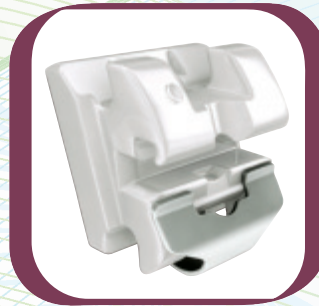
In-Ovation® C : Das unübertroffene transluzente Keramikbracket