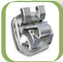
In-Ovation® L MTM : Speziell für minimale Korrekturen

EINE KOMPLETTE LINIE VON EFFIZIENTEN SELBSTLIGIERENDEN BRACKETS