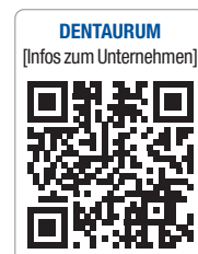
DENTAURUM [Infos zum Unternehmen]