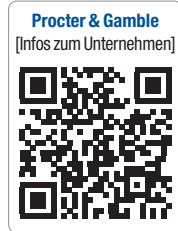
Procter & Gamble [Infos zum Unternehmen]