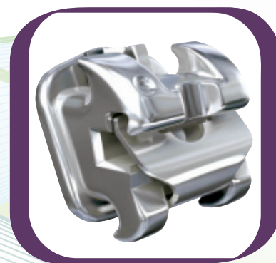
In-Ovation® R : Das Original! Das führende selbstligierende Metallbracket

In-Ovation® – DENTSPLY GAC bietet eine komplette Produktserie bei selbstligierenden Brackets. In-Ovation® Brackets – unübertroffen in Design, Vielseitigkeit, Zuverlässigkeit und Effizienz für präzise Resultate und zufriedene Patienten!