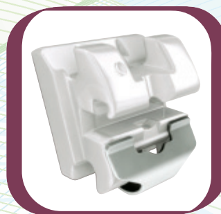
In-Ovation® C : Das unübertroffene transluzente Keramikbracket