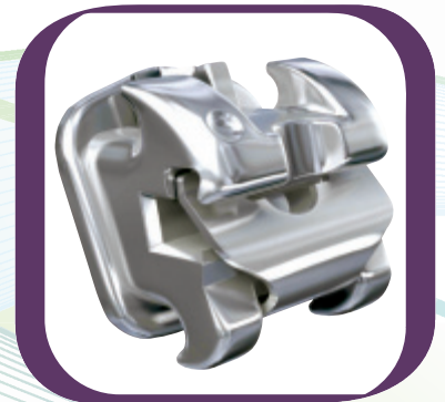
In-Ovation® R : Das Original! Das führende selbstligierende Metallbracket

In-Ovation® – DENTSPLY GAC bietet eine komplette Produktserie bei selbstligierenden Brackets. In-Ovation® Brackets – unübertroffen in Design, Vielseitigkeit, Zuverlässigkeit und Effizienz für präzise Resultate und zufriedene Patienten!