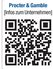
Procter & Gamble [Infos zum Unternehmen]