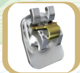
In-Ovation® L : Das linguale selbstligierende Bracket