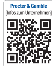
Procter & Gamble [Infos zum Unternehmen]