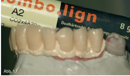
Abb. 14: Die Wachsmodellation auf dem Muffelträger. – Abb. 15: Das in BioHPP-gepresste Gerüst direkt nach dem Ausbetten. – Abb. 16: Deckendes Auftragen des Opakers. – Abb. 17: Nach dem Befestigen der Verblendschalen wurden Fehlstellen nachgetragen und die Verblendung der Gingivabereiche konnte vorgenommen werden.