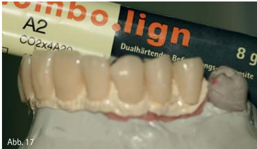
Abb. 14: Die Wachsmodellation auf dem Muffelträger. – Abb. 15: Das in BioHPP-gepresste Gerüst direkt nach dem Ausbetten. – Abb. 16: Deckendes Auftragen des Opakers. – Abb. 17: Nach dem Befestigen der Verblendschalen wurden Fehlstellen nachgetragen und die Verblendung der Gingivabereiche konnte vorgenommen werden.