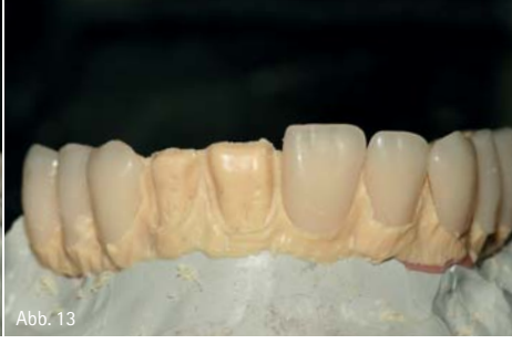
Abb. 7: Die aus PEEK-Material (BioHPP) umgesetzten Primärteile wurden im Fräsgerät auf 0 Grad parallelisiert. – Abb. 8: Prüfen der okklusalen Gegebenheiten im Artikulator (Wachsaufstellung). – Abb. 9: Die für die Gerüstmodellation vorbereitete Oberkieferversorgung (Wachsaufstellung). – Abb. 10 und 11: Modellation der Sekundärstruktur. Ein Steg aus Kunststoff stellte die Basis für die Wachmodellation. Die im Silikonwall fixierten Verblendschalen wurden mit Wachs aufgefüllt und ein graziles, exakt auf die Situation abgestimmtes Brückengerüst modelliert. – Abb. 12: Wachsaufstellung mit den Verblendschalen. – Abb. 13: Die Verblendschalen wurden entfernt und können später auf das BioHPP-Gerüst reponiert werden.

zitätsmodul. Eine hohe Bruchdehnung und hohe Elastizität sowie Schlagfestigkeit sind weitere Fürsprecher. Zu diesen vielen positiven Aspekten war für uns auch die wirtschaftliche Fertigung einer Restauration aus dem Hochleistungspolymer BioHPP ausschlaggebend, um das Material vor sechs Jahren erstmals in unserem Laboralltag einzusetzen. Zum damaligen Zeitpunkt wurde BioHPP beziehungsweise ein auf PEEK-basierendes Material für die prothetische Zahnmedizin von vielen Seiten kritisch beäugt. Wir haben an dieses Material geglaubt, arbeiten seitdem mit sehr positiven Erfahrungen damit und können auf einen langjährigen Erfahrungsschatz zurückblicken.