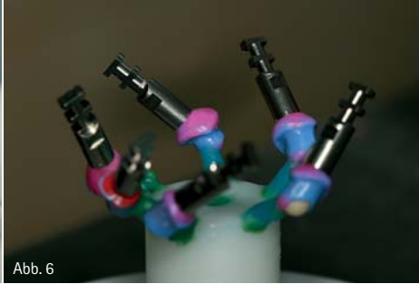
Abb. 3: Das Implantatmodell als Grundlage für die Anfertigung der prothetischen Rekonstruktion. – Abb. 4: Im Fräsgerät wurden die Titanbasen (SKY elegance Abutment) beschliffen. – Abb. 5: Auf die Titanbasen sind die Primärteile beziehungsweise Abutments modelliert worden. – Abb. 6: Die Titanbasen mit den aufmodellierten Primärteilen sind für das Überpressen vorbereitet.