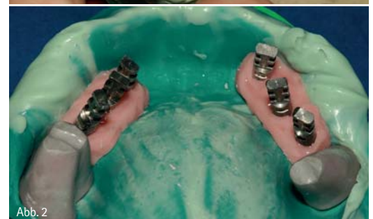
Abb. 1 und 2: Herstellung eines Modells mit Gingivamaske und herausnehmbaren Stümpfen (Molaren).