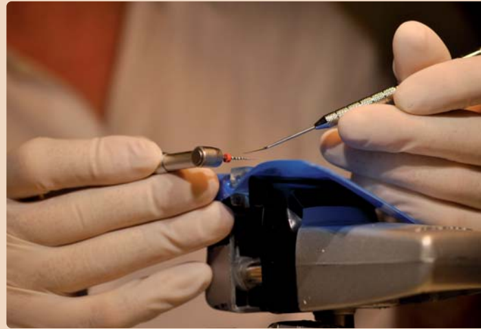
Historische Augenblicke für die Teilnehmer in Frankfurt am Main: endodontisches Instrumentarium in den Händen von Cliff Ruddle während des nachmittäglichen Workshops. – Ein Tag mit vollem Endo-Programm: Cliff Ruddle beginnt mit einer klaren Agenda.

reduzieren unter anderem die Gefahr einer Kanalverlagerung und machen die Endodontie einfacher und sicherer. Aus Ruddles Sicht erleichtert der exzentrische Feilenquerschnitt von PROTAPER NEXT zu-