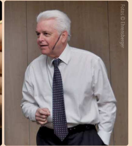
Historische Augenblicke für die Teilnehmer in Frankfurt am Main: endodontisches Instrumentarium in den Händen von Cliff Ruddle während des nachmittäglichen Workshops. – Ein Tag mit vollem Endo-Programm: Cliff Ruddle beginnt mit einer klaren Agenda.

des Wurzelkanals mit Nickel-Titan-Instrumenten bis hin zur thermoplastischen Obturation.