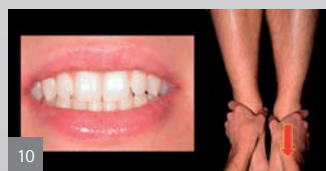
Abb. 5: Nach dem Meersseman-Test. Becken und Wirbelsäule sind gerader, aber Blockaden und Muskelverspannungen sind noch vorhanden. – Abb. 6: Nach dem Meersseman-Test ist das Becken bei einer funktionellen Beinlängendifferenz gerade. Frage an den Patienten: Wo ist jetzt der erste Kontakt? – Abb. 7 und 8: Variable Beinlängendifferenz. – Abb. 9: Nach dem M-Test: Variabler Beinlängendifferenztest ohne Zahnkontakt: Beine sind gleich lang. – Abb. 10: Nach dem M-Test: Variabler Beinlängendifferenztest mit Zahnkontakt: linkes Bein schiebt vor.