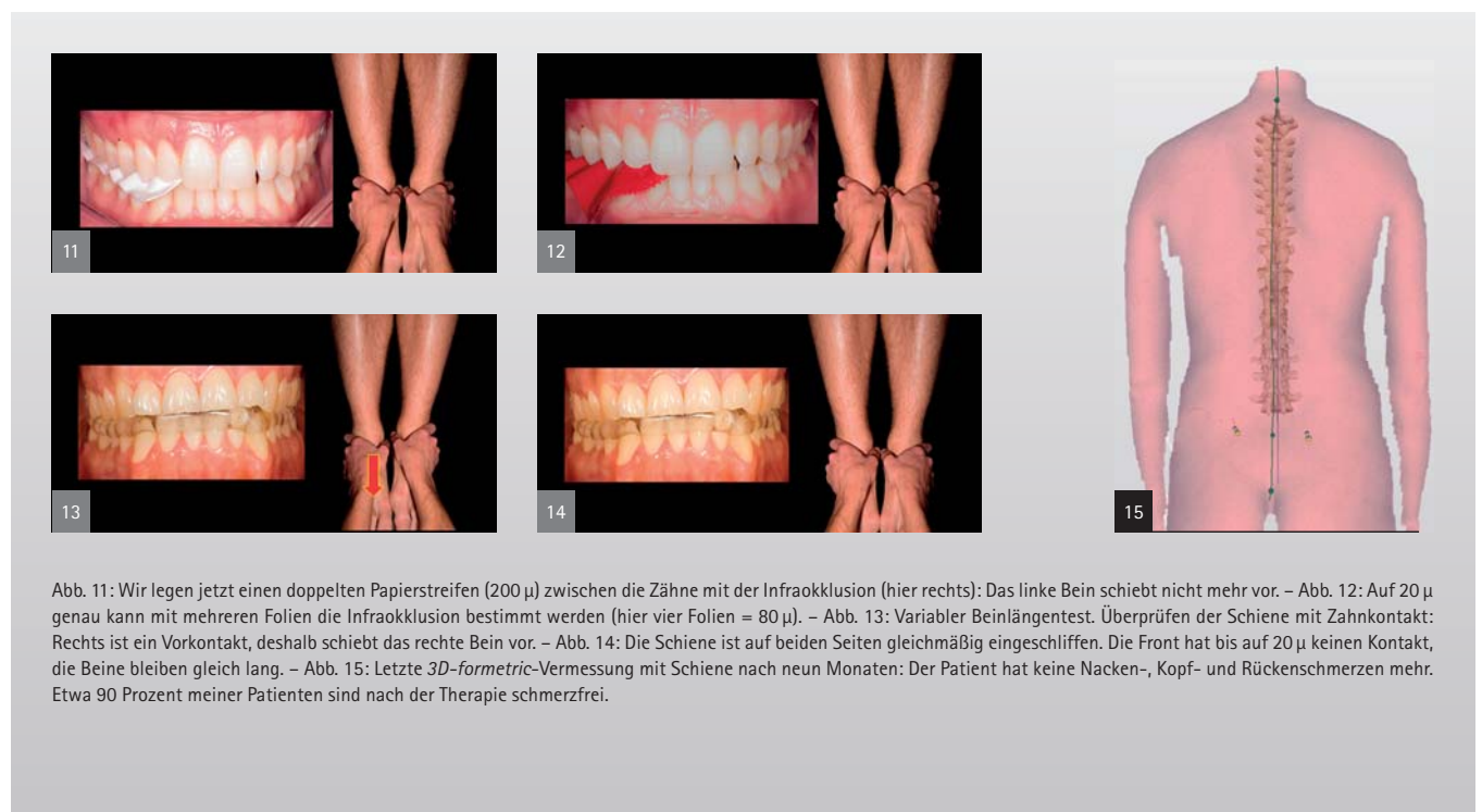
Abb. 11: Wir legen jetzt einen doppelten Papierstreifen (200 \mu ) zwischen die Zähne mit der Infraokklusion (hier rechts): Das linke Bein schiebt nicht mehr vor. – Abb. 12: Auf 20 \mu genau kann mit mehreren Folien die Infraokklusion bestimmt werden (hier vier Folien = 80 \mu ). – Abb. 13: Variabler Beinlängentest. Überprüfen der Schiene mit Zahnkontakt: Rechts ist ein Vorkontakt, deshalb schiebt das rechte Bein vor. – Abb. 14: Die Schiene ist auf beiden Seiten gleichmäßig eingeschliffen. Die Front hat bis auf 20 \mu keinen Kontakt, die Beine bleiben gleich lang. – Abb. 15: Letzte 3D-formetric-Vermessung mit Schiene nach neun Monaten: Der Patient hat keine Nacken-, Kopf- und Rückenschmerzen mehr. Etwa 90 Prozent meiner Patienten sind nach der Therapie schmerzfrei.

Letzte 3-D-Vermessung mit Schiene nach neun Monaten, der Patient hat keine Kopf-, Nacken- und Rückenschmerzen mehr. Etwa 90 Prozent meiner Patienten sind nach dieser Therapie schmerzfrei (Abb. 15).