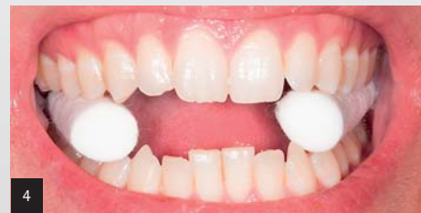
Abb. 2: 3D-formetric-Vermessung der Wirbelsäule: Skoliose der Wirbelsäule. Patient mit Kopf-, Nacken- und Rückenschmerzen. – Abb. 3: Beckenmessung: Das linke Becken ist 10 mm tiefer und das linke Bein deshalb funktionell 10 mm länger. – Abb. 4: Meersseman-Test.