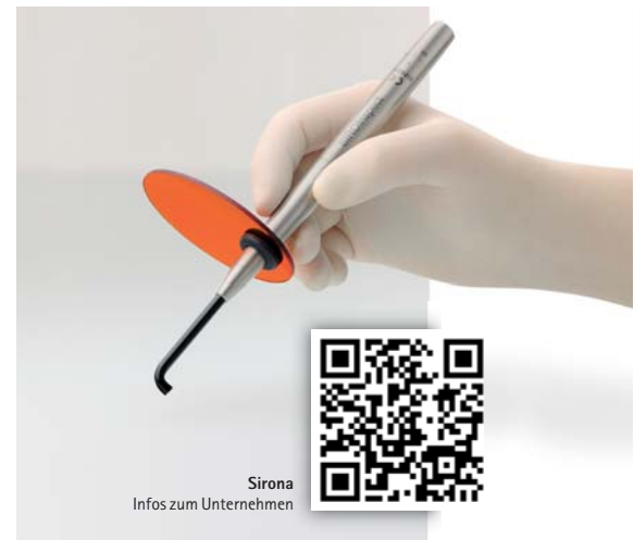
Sirona Infos zum Unternehmen

Das Detektionssystem zur Karieskontrolle SIROInspect basiert auf der „Fluorescence Aided Caries Excavation-Technologie“, kurz FACE®, die die Fluoreszenzeigenschaften von Zähnen nutzt. Unter violetterm Licht im Bereich von circa 405 nm werden sowohl die Abbauprodukte der Kariesbakterien als auch gesundes Dentin zur Fluoreszenz angeregt. Gesundes Zahngewebe leuchtet grün, die kariösen Bereiche rot.