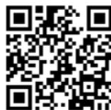
Champions-Implants GmbH Infos zum Unternehmen

Champions OP- und Prothetik-Tray. Es umfasst für das komplette System (ein- und zweiteilig) nur sehr wenig Werkzeuge und ist für einen noch besseren Workflow in der Praxis äußerst übersichtlich angeordnet. Die Box integriert unter anderem eine lange flexible KKK-(Knochen-Kavitäten-Kontrolle-)Sonde für das MIMI®-flapless-Verfahren, eine Drehmomentratsche, insgesamt vier Condenser und vier konische Dreikant-, zwei Spiral- (für D1) und einen Krestal-Bohrer. Systemumsteiger auf das Champions-System haben weiterhin die Möglichkeit, die Champions-Box und Implantate für die beiden ersten Patientenfälle zur Verfügung gestellt zu bekommen.