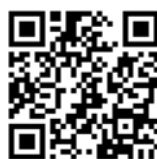
Champions-Implants GmbH Infos zum Unternehmen

Champions OP- und Prothetik-Tray. Es umfasst für das komplette System (ein- und zweiteilig) nur sehr wenig Werkzeuge und ist für einen noch besseren Workflow in der Praxis äußerst übersichtlich angeordnet. Die Box integriert unter anderem eine lange flexible KKK-(Knochen-Kavitäten-Kontrolle-)Sonde für das MIMI®-flapless-Verfahren, eine Drehmomentratsche, insgesamt vier Condenser und vier konische Dreikant-, zwei Spiral- (für D1) und einen Krestal-Bohrer. Systemumsteiger auf das Champions-System haben weiterhin die Möglichkeit, die Champions-Box und Implantate für die beiden ersten Patientenfälle zur Verfügung gestellt zu bekommen.