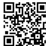
Directa AB Deutschland Infos zum Unternehmen

Das Ergebnis der bisher durchgeführten Extraktionen war stets positiv – die Wunden waren sauber, präzise geschnitten und mit keinen oder nur wenig Gewebeschäden. All diese Vorteile führen zu einem schnelleren Heilungsverlauf und einem verbesserten Knochenerhalt.