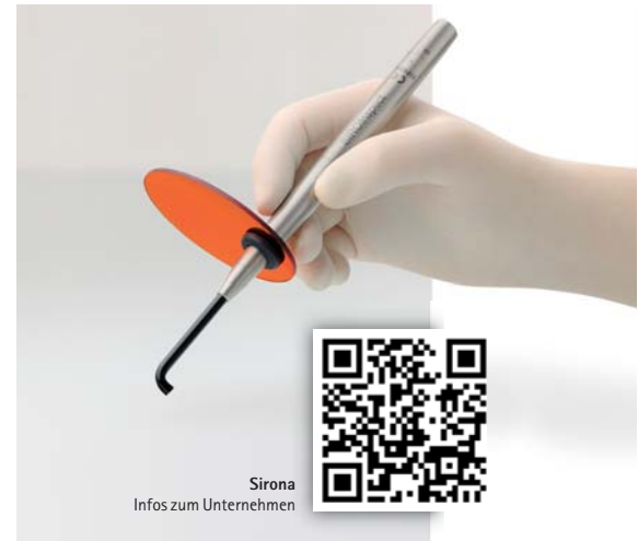
Sirona Infos zum Unternehmen

Das Detektionssystem zur Karieskontrolle SIROInspect basiert auf der „Fluorescence Aided Caries Excavation-Technologie“, kurz FACE®, die die Fluoreszenzeigenschaften von Zähnen nutzt. Unter violettem Licht im Bereich von circa 405 nm werden sowohl die Abbauprodukte der Kariesbakterien als auch gesundes Dentin zur Fluoreszenz angeregt. Gesundes Zahngewebe leuchtet grün, die kariösen Bereiche rot.