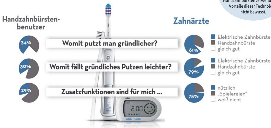
Abb. 1: Noch viel Aufklärungsarbeit nötig: Während ein Großteil der Zahnärzte von der elektrischen Mundpflege überzeugt ist, sind vielen Handzahnbürstenverwendern die Vorteile dieser Technologie nicht bewusst.

Eine kontinuierliche und effektive häusliche Prophylaxe ist Grundvoraussetzung für eine gute Mundgesundheit. In diesem Zusammenhang kommt der Wahl der richtigen Zahnbürste eine wichtige Rolle zu, das bestätigt jetzt auch eine aktuelle Umfrage des Meinungsforschungsinstituts forsa. Dabei gaben etwa mehr als zwei Drittel der über 500 befragten Zahnärzte an, dass sich die Mundgesundheit in Deutschland verbessern würde, wenn mehr Menschen mit rotierend-pulsierenden Elektrozahnbürsten putzen würden.