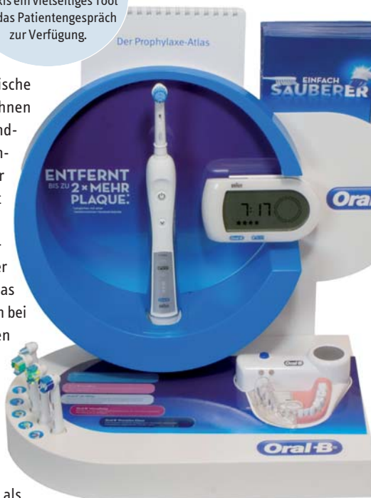
Abb. 3: Mit der Oral-B Beratungsstation steht der Praxis ein vielseitiges Tool für das Patientengespräch zur Verfügung.

sinnvoll, da dadurch Putzfehler vermieden werden könnten. An vorderster Stelle findet in diesem Zusammenhang die Andruckkontrolle Erwähnung, 70 Prozent der befragten Zahnärzte geben an, dass diese zu viel Druck vermeide und somit für eine schonendere Reinigung Sorge. Mit 68 Prozent nur knapp dahinter wird der Timer genannt – er vermeide eine zu kurze Putzzeit bzw. Reinigungsdauer. Auf einem guten dritten Platz landet der Quadrantentimer, ihm schreiben 62 Prozent der befragten Zahnärzte einen positiven Einfluss auf die Putzsystematik zu.