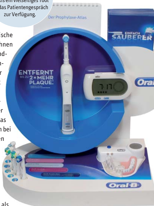
Abb. 3: Mit der Oral-B Beratungsstation steht der Praxis ein vielseitiges Tool für das Patientengespräch zur Verfügung.

Was die Einschätzung der elektrischen Mundpflege betrifft, liegen die Ansichten von Zahnärzten und Handzahnbürstenverwendern also deutlich auseinander. Doch was ist für diese unterschiedlichen Standpunkte verantwortlich? Ein Blick auf den jeweiligen Wissensstand der Befragten gibt Aufschluss: Während sich Zahnärzte berufsbedingt über neue Forschungsergebnisse auf dem Gebiet der Prophylaxe im Klaren sind, kennen Patienten diese Informationen in vielen Fällen nicht. Die überzeugende Studienlage zur Überlegenheit der elektrischen Mundpflege ist zwar in Fachkreisen bekannt, Otto Normalverbraucher hingegen fehlt diese Grundlage. Selbstverständlich lässt sich von einem Patienten nicht erwarten, sich mit klinischen Studien zu Reinigungsleistung, Gingivitisreduktion, Putzzeit oder Sanfttheit auseinanderzusetzen – genau hier punkten allerdings elektrische Zahnbürsten mit oszillierend-rotierender Reinigungstechnologie gegenüber anderen Technologien (Abb. 2). Ziel des Praxisteams kann es dementsprechend nur sein, diese wissenschaftlichen Erkenntnisse verständlich an den Patienten weiterzugeben und ihn somit zum Wechsel zur Elektrozahnbürste zu bewegen. Denn dass ein solches Umdenken einen positiven Einfluss hat, da ist sich die Mehrheit der befragten Zahnärzte einig: 67 Prozent der durch forsa befragten Zahnärzte gehen davon aus, dass sich die Mundgesundheit in Deutschland verbessern würde, wenn mehr Menschen mit rotierend-pulsierenden Elektrozahnbürsten putzen würden.