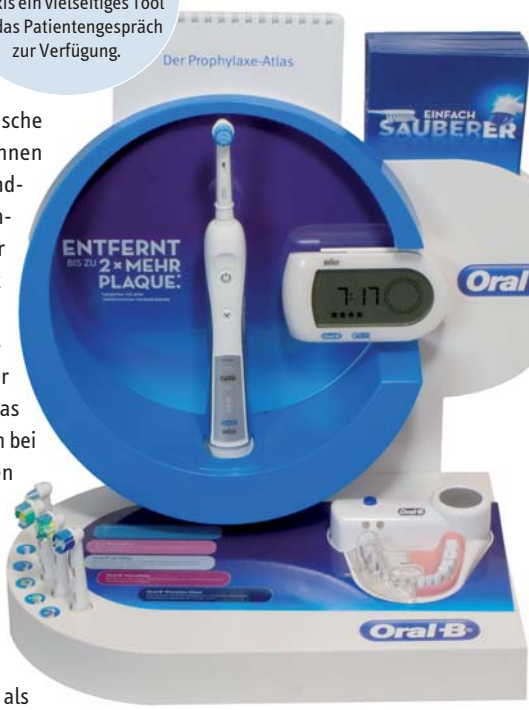
Abb. 3: Mit der Oral-B Beratungsstation steht der Praxis ein vielseitiges Tool für das Patientengespräch zur Verfügung.

sinnvoll, da dadurch Putzfehler vermieden werden könnten. An vorderster Stelle findet in diesem Zusammenhang die Andruckkontrolle Erwähnung, 70 Prozent der befragten Zahnärzte geben an, dass diese zu viel Druck vermeide und somit für eine schonendere Reinigung Sorge. Mit 68 Prozent nur knapp dahinter wird der Timer genannt – er vermeide eine zu kurze Putzzeit bzw. Reinigungsdauer. Auf einem guten dritten Platz landet der Quadrantentimer, ihm schreiben 62 Prozent der befragten Zahnärzte einen positiven Einfluss auf die Putzsystematik zu.