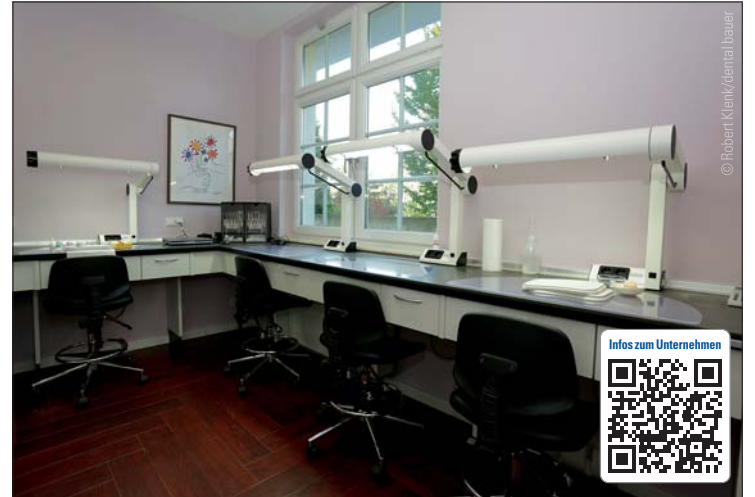
Das Labor HMT Zahntechnik in Leinfelden bei Stuttgart, geplant von dental bauer.

Laborgründers so verwirklicht, dass er ein einmaliges Ergebnis entsprechend seiner eigenen