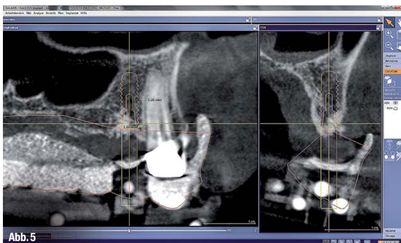
▲ Abb. 5: Vorbereitung und Implantatplanung ergaben eine Implantatposition in Regio 14, die alle erforderlichen Voraussetzungen für eine Implantation erfüllte.