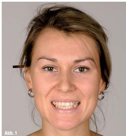
Abb. 1 _ Optimal sollten Vorher-Nachher-Bilder nicht für die Werbung, sondern nur im Rahmen der Patientenaufklärung genutzt werden.

Unabhängig von der rechtlichen Einschätzung stellt sich ohnehin die Frage, ob Vorher-Nachher-Bilder in der Werbung Sinn machen. Bei der Beantwortung dieser Frage ist zu berücksichtigen, dass Werbung eine Form der Kommunikation ist, mit der ein Unternehmen tatsächliche oder potenzielle Kunden in seinem Sinne zu beeinflussen versucht. Dies soll in aller Regel erreicht werden, indem die beworbenen Produkte oder Dienstleistungen mit einem emotionalen Erlebniswert verknüpft werden. Beispiele für die Vermittlung positiver Emotionen über Werbung