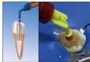
EndoREZ wird mit dem patentierten NaviTip (Ø 0,33 mm) blasenfrei von apikal nach koronal eingebracht und füllt die Kanal-Anatomie schnell und sicher.