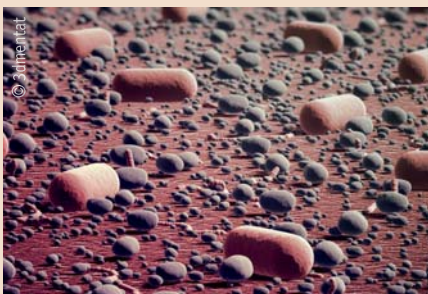
Mikrobenverteilung im menschlichen Biofilm unterscheidet sich von Mensch zu Mensch eindeutig.

Struktur innehat, dass jeder dadurch identifizierbar ist.