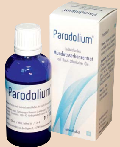
Parodolium – individuelles Mundwasser-konzentrat.