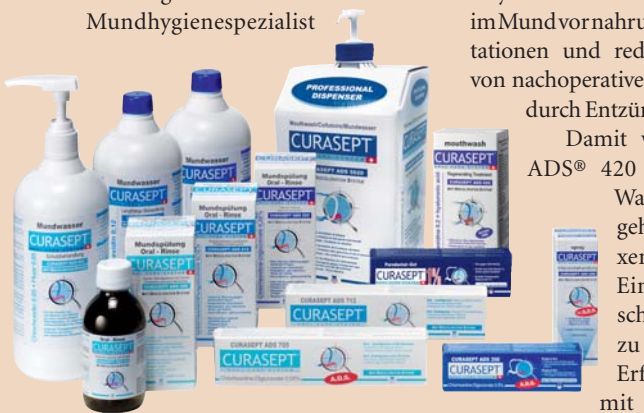
Die CURASEPT-Familie: Das CHX-Sortiment der Firma CURAPROX ist äusserst vielfältig.

Die Hyaluronsäure der Mundspülung CURASEPT ADS® 420 wirkt in drei Schritten. Zunächst bildet sie einen Schutzfilm auf den Schleim-