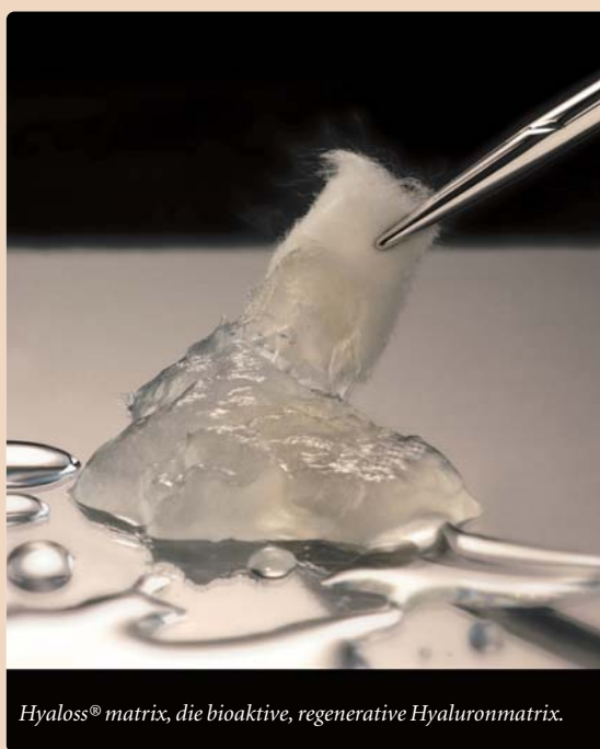
Hyaloss® matrix, die bioaktive, regenerative Hyaluronmatrix.

Sobald die Fasern der Matrix mit Flüssigkeit in Berührung geraten, wird sie geförmig und kann so äus-