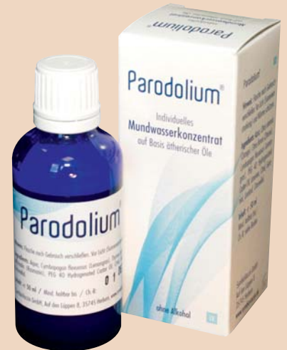
Parodolium – individuelles Mundwasserkonzentrat.