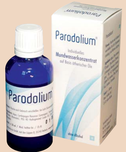
Parodolium – individuelles Mundwasserkonzentrat.