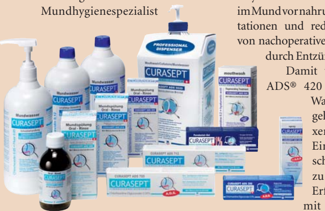
Die CURASEPT-Familie: Das CHX-Sortiment der Firma CURAPROX ist äusserst vielfältig.

Die Hyaluronsäure der Mundspülung CURASEPT ADS® 420 wirkt in drei Schritten. Zunächst bildet sie einen Schutzfilm auf den Schleim-