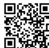
Pluradent AG & Co KG Infos zum Unternehmen

Anmeldungen sind ab sofort unter www.pluradent.de/symposium2014 , bei Pluradent-Außendienstmitarbeitern und im Depot möglich. Bis zum 15. Januar 2014 erhalten Teilnehmer einen Frühbucherrabatt.