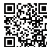
Pluradent AG & Co KG Infos zum Unternehmen

Anmeldungen sind ab sofort unter www.pluradent.de/symposium2014 , bei Pluradent-Außendienstmitarbeitern und im Depot möglich. Bis zum 15. Januar 2014 erhalten Teilnehmer einen Frühbucherrabatt.