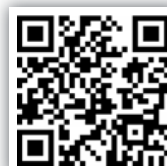
Kuraray Europe GmbH Infos zum Unternehmen

Schütteln der Flasche, erneutes, mehrfaches Auftragen und das Einmassieren auf der Zahnoberfläche, nicht mehr notwendig sind.