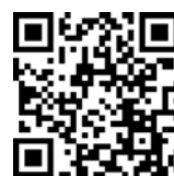
Ultradent Products Infos zum Unternehmen

Mit der Opalescence®-Palette bietet die Firma Ultradent Products Produkte für die Zahnaufhellung, die eine hohe Wirksamkeit mit hoher Ästhetik verbinden. Neben leistungsstarken Wirkstoffen kräftigen diese durch Kaliumnitrat und Fluoride die Zahnschmelze – und machen sich damit für gleichermaßen gesunde und schöne Zähne stark.