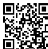
Ultradent Products Infos zum Unternehmen

Mit der Opalescence®-Palette bietet die Firma Ultradent Products Produkte für die Zahnaufhellung, die eine hohe Wirksamkeit mit hoher Ästhetik verbinden. Neben leistungsstarken Wirkstoffen kräftigen diese durch Kaliumnitrat und Fluoride die Zahnschmelze – und machen sich damit für gleichermaßen gesunde und schöne Zähne stark.