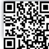
SICAT GmbH & Co. KG Infos zum Unternehmen

SICAT GmbH & Co. KG Tel.: 0228 854697-0 www.sicat.de