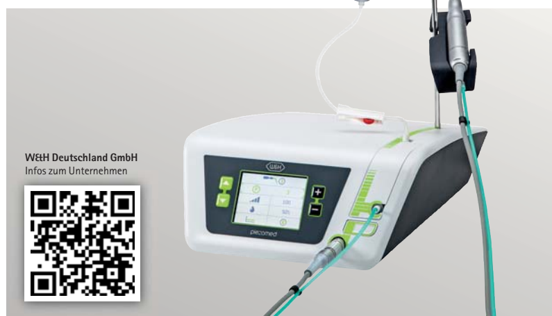
W&H Deutschland GmbH Infos zum Unternehmen