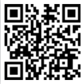
enretec GmbH Infos zum Unternehmen

Gemeinsam für mehr Bildung! Das ist die Devise des Entsorgungsfachbetriebs enretec GmbH.