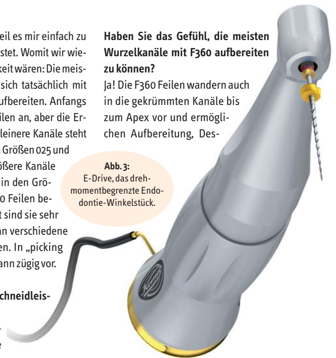
Abb. 3: E-Drive, das drehmomentbegrenzte Endodontie-Winkelstück.

„Doch sobald Stress oder Krankheit mit ins Spiel kommen, kann der Körper die Dinge nicht mehr kompensieren und ‚der Zahn geht hoch‘. Die Frage an den Patienten ‚Waren Sie in letzter Zeit krank?‘ zeigt jedem Zahnarzt die komplexen Zusammenhänge auf.“