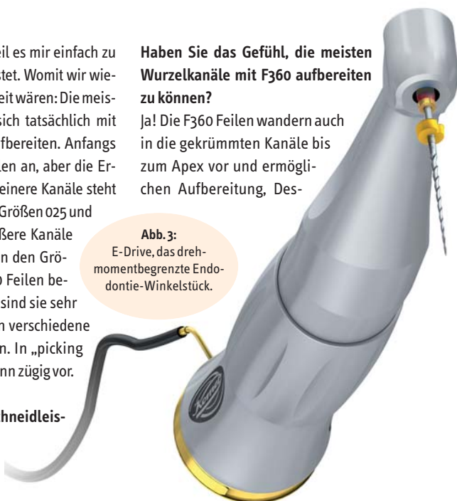
Abb. 3: E-Drive, das drehmomentbegrenzte Endodontie-Winkelstück.

„Doch sobald Stress oder Krankheit mit ins Spiel kommen, kann der Körper die Dinge nicht mehr kompensieren und ‚der Zahn geht hoch‘. Die Frage an den Patienten ‚Waren Sie in letzter Zeit krank?‘ zeigt jedem Zahnarzt die komplexen Zusammenhänge auf.“