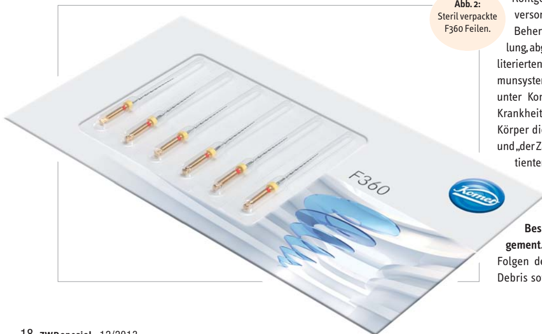
Abb. 2: Steril verpackte F360 Feilen.

infektion und Füllung. Wenn wir von Grenzen der Behandlung sprechen, dann werden diese weniger durch die Instrumente verursacht. Der endodontische Misserfolg hängt, meiner langjährigen Erfahrung nach, eher mit der persönlichen Abwehrlage eines Patienten zusammen. Wirklich jeder Zahnarzt hat schon Röntgenbilder von schlecht endodontisch versorgten Zähnen gesehen mit kleiner Beherrdung, unvollständiger Wurzelfüllung, abgebrochenen Instrumenten und obliterierten Kanälen usw. Aber ein intaktes Immunsystem hält die Situation offensichtlich unter Kontrolle. Doch sobald Stress oder Krankheit mit ins Spiel kommen, kann der Körper die Dinge nicht mehr kompensieren und „der Zahn geht hoch“. Die Frage an den Patienten „Waren Sie in letzter Zeit krank?“ zeigt jedem Zahnarzt die komplexen Zusammenhänge auf.