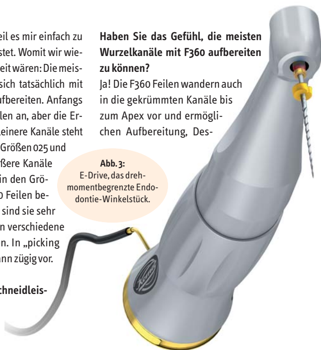
Abb. 3: E-Drive, das drehmomentbegrenzte Endodontie-Winkelstück.

„Doch sobald Stress oder Krankheit mit ins Spiel kommen, kann der Körper die Dinge nicht mehr kompensieren und ‚der Zahn geht hoch‘. Die Frage an den Patienten ‚Waren Sie in letzter Zeit krank?‘ zeigt jedem Zahnarzt die komplexen Zusammenhänge auf.“