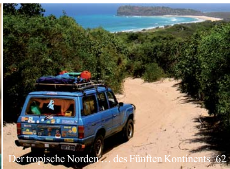
Der tropische Norden... des Fünften Kontinents 62