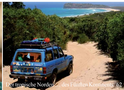
Der tropische Norden... des Fünften Kontinents 62