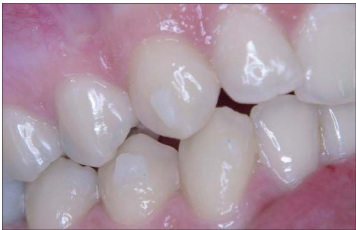
Abb. 11: Nach Abnahme der Templateschiene verbleiben die adhäsiv befestigten Attachments. Es ist kein Überschuss erkennbar. Auch feinste Strukturen werden entsprechend der Schablone durch SDR wiedergegeben.

lung wurden Korrekturabformungen mit Aquasil (Fa. DENTSPLY) erstellt und zum Scannen und Umsetzen einer computergestützten Behandlungssimulation (ClinCheck®) an Align Technology übersandt. Der ClinCheck® wird vom Behandler anschließend online entsprechend den erforderlichen Zahnbewegungen kontrolliert, verändert, vervollständigt und freigegeben. Im Rahmen dieser Planung werden empfohlene und optimierte Attachments in Form und Position angezeigt und können durch den Behandler verändert werden. Ebenso werden in dieser Phase Precision Cuts für die Applikation zusätzlicher Gummizüge oder Cut Outs für die Befestigung von Knöpfchen oder Häkchen geplant. Entsprechend der freigegebenen ClinCheck®-Planung werden die Aligner serien für Ober- und Unterkiefer hergestellt.