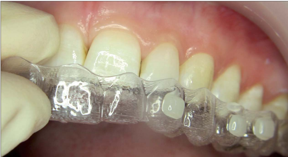
Abb. 7: Das Template wird auf den vorbereiteten Kiefer gesetzt. Dabei sind alle Attachmentformen im Template mit SDR befüllt. SDR bleibt während der Schienenpositionierung in den Attachmentnegativen.