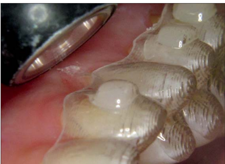
Abb. 8: Situation nach Positionierung des Attachment-Templates. SDR hat sich blasen- und überschussfrei an die Schmelzoberfläche adaptiert. – Abb. 9: Die Lichtpolymerisation erfolgt durch die Folie der Schablone.