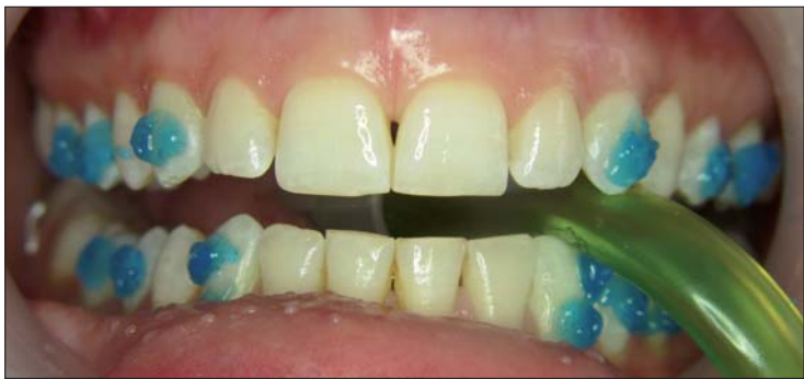
Abb. 1: Lokale Phosphorsäurekonditionierung an den geplanten Attachmentpositionen.