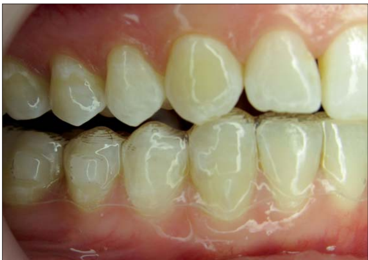
Abb. 2: Situation nach Schmelzkonditionierung bei relativer Trockenlegung. – Abb. 3: Im Unterkiefer wurde das Attachmenttemplate bereits eingesetzt. Im Oberkiefer wurde die Schmelzoberfläche mit XP Bond gebondet.