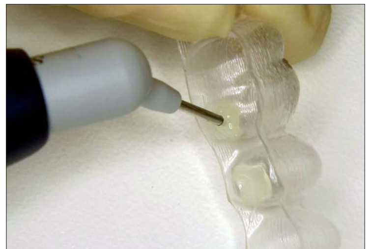
Abb. 4: Applikation von SDR in die Negativform der Attachments im Template. – Abb. 5: Aufgrund der niedrigen Viskosität und der feinen CompuKa-Kanüle lässt sich SDR sehr exakt applizieren. – Abb. 6: Die Thixotropie von SDR lässt einmal appliziertes Material ohne Verfließen an Ort und Stelle verbleiben, während weitere Attachmentformen in der Schablone aufgefüllt werden.

wird die Form und Position der optimierten Attachments softwaregestützt errechnet. Optimierte Attachments sind häufig kleiner als konventionelle Attachments, enden auf einer Seite tropfenförmig und auf der anderen Seite abgekantet und werden oft als zwei separate Attachments auf die Zahnoberfläche aufgebracht. Um eine ideale Wirkung aller Attachments zu erzielen, ist es außerordentlich wichtig, dass die errechnete Form, speziell bei den kleineren, individuell geformten optimierten Attach-