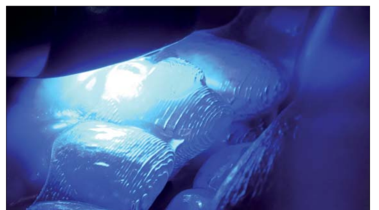
Abb. 10: Die transparente Farbeinstellung von SDR ermöglicht die komplette Polymerisation des Attachments durch die Templatefolie in einem Polymerisationszyklus.