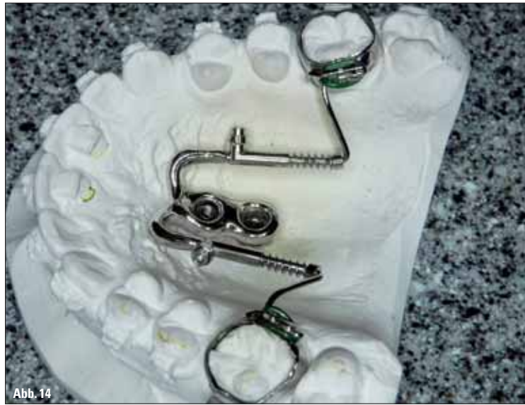
Abb. 13: Seitenansicht konventioneller Distal-Jet auf dem Modell. – Abb. 14: Seitenansicht gegossener Distal-Jet (Miniimplantat-gestützt) auf dem Modell.

die Idee auf, die Modellgusstechnik dafür zu nutzen. Also wurde schließlich das Verbindungsteil (Suprakonstruktion) individuell modelliert und gegossen (Abb. 7, 8). Die konfektionierten Distal-Jet-Teleskope wurden anschließend angelasert. Es entstand eine stabile und passgenaue maximale Verankerungseinheit, der gegossene Distal-Jet (Abb. 9, 14). Das Gerät lässt sich im Patientenmund bequem einsetzen und mit den Innenschraubchen an den Miniimplantaten fixieren (Abb. 10). Die Aktivierung der 240-g-Feder geht genauso schnell und einfach wie beim herkömmlichen Distal-Jet.