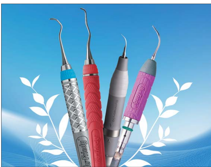
Ein Beitrag zum Umweltschutz: Das Recyclingprogramm von Hu-Friedy.

Endspurt bei der Recyclingoffensive von Hu-Friedy, dem führenden Hersteller von Dentalprodukten: Noch bis Ende 2013 können auf allen Fach- und Infodental-Messen alte Instrumente am Stand von Hu-Friedy abgegeben werden. Das gesammelte Material wird wiederverwertet und dient als Rohstoff für neue Produkte, etwa in der Bau- und Autoindustrie. Ein besonderes Angebot gilt für die Rückgabe von Scalern und Kü-