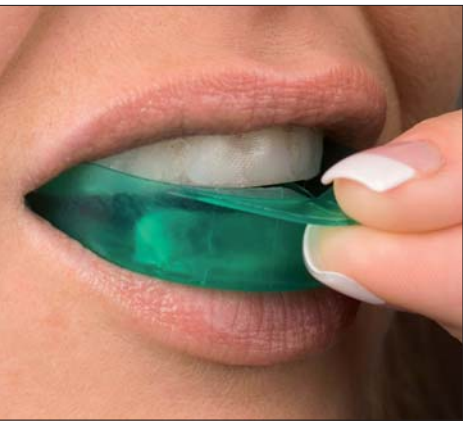
Sofort starten – mit den gebrauchsfertigen UltraFit-Trays von Opalescence Go.

Sie mögen Opalescence TrèswHITE Supreme? Dann werden Sie Opalescence Go lieben!