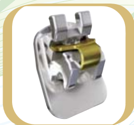
In-Ovation® L : Das linguale selbstligierende Bracket