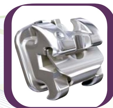
In-Ovation® R : Das Original! Das führende selbstligierende Metallbracket

In-Ovation® – DENTSPLY GAC bietet eine komplette Produktserie bei selbstligierenden Brackets. In-Ovation® Brackets – unübertroffen in Design, Vielseitigkeit, Zuverlässigkeit und Effizienz für präzise Resultate und zufriedene Patienten!