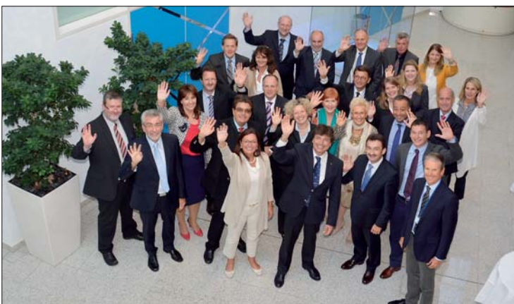
Die Teilnehmer des diesjährigen Strategie-Meetings verständigten sich darauf, das weltweite Netzwerk der Dentaforum-Gruppe weiter auszubauen und zu intensivieren.

Internationales Strategie-Meeting bei der Dentaforum-Gruppe.