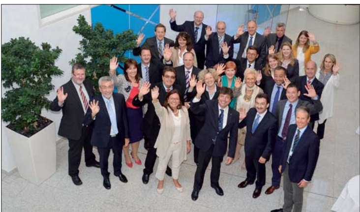
Die Teilnehmer des diesjährigen Strategie-Meetings verständigten sich darauf, das weltweite Netzwerk der Dentaforum-Gruppe weiter auszubauen und zu intensivieren.

Internationales Strategie-Meeting bei der Dentaforum-Gruppe.