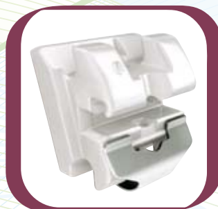
In-Ovation® C : Das unübertroffene transluzente Keramikbracket