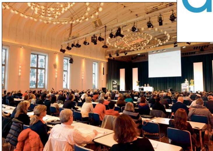
Die Vorbereitungen laufen bereits auf Hochtouren – am 21./22. November 2014 findet der nunmehr 3. Wissenschaftliche Kongress für Aligner-Orthodontie in Köln statt (im Bild: Impressionen der letztjährigen Veranstaltung).

Deutsche Gesellschaft für Aligner Orthodontie (DGAO) e.V. Olgastraße 39 70182 Stuttgart Tel.: 0711 27395591 Fax: 0711 6550481 info@dgao.com www.dgao.com