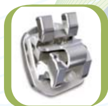
In-Ovation® LMTM : Speziell für minimale Korrekturen

EINE KOMPLETTE LINIE VON EFFIZIENTEN SELBSTLIGIERENDEN BRACKETS