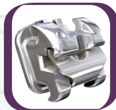
In-Ovation® R : Das Original! Das führende selbstligierende Metallbracket

In-Ovation® – DENTSPLY GAC bietet eine komplette Produktserie bei selbstligierenden Brackets. In-Ovation® Brackets – unübertroffen in Design, Vielseitigkeit, Zuverlässigkeit und Effizienz für präzise Resultate und zufriedene Patienten!