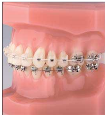
Perfekt getarnt und nahezu unsichtbar – die QuickKlear®-Brackets von FORESTADENT. Ab sofort sind diese von 5 bis 5 im Oberkiefer erhältlich.

QuickKlear®-System und rundet dieses optimal ab. Das Quick-Bogeninstrument er-