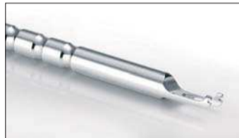
Mithilfe des neuen Quick®-Bogeninstruments lassen sich Bögen noch einfacher und schneller in den Bracketslot einlegen.

möglicht dem Anwender, Bögen künftig noch sicherer bei schwierigen Situationen, wie z. B. stark verlagerten Eckzähnen oder stark rotierten Zähnen, in den Bracketslot einzulegen. Doch nicht nur die brandneuen Innovationen stießen am FORESTADENT-Stand auf großes Interesse. So sorgte u. a. das extrem flache 2D®-Lingualbracketsystem für rege Nachfragen. Auch der Functional Mandibular Advancer (FMA) zur compliance-unabhängigen Korrektur von Klasse II-Anomalien war Mittelpunkt zahlreicher Standgespräche.