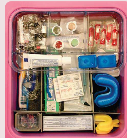
Alles fest im Blick: In diesen Kunststoffschalen können Verbrauchsmaterialien gut geschützt geordnet und transportiert werden.

Weiteres Tool für Effizienz im Praxisalltag – Mit den neuen Kunststoffschalen „Signature Series Tubs“ präsentiert Hu-Friedy eine zeitsparende Möglichkeit zur Organisation und zum sicheren Transport von Verbrauchsmaterialien.