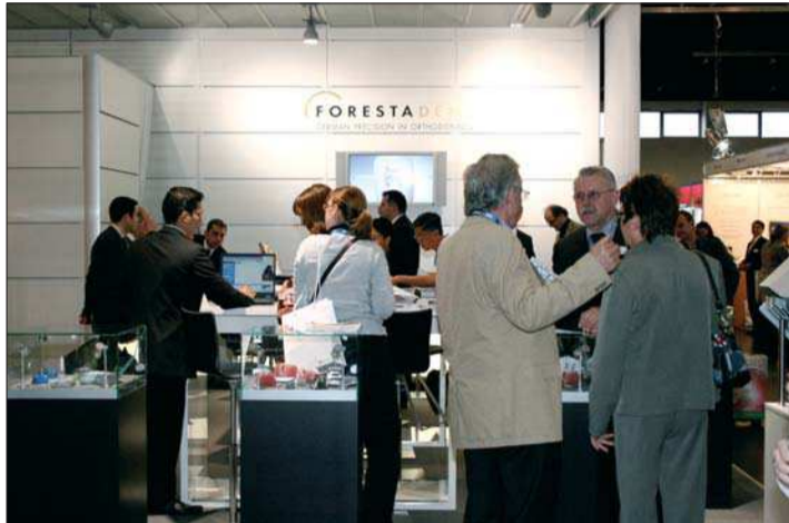
Beeindruckt zeigten sich die zahlreichen Besucher des FORESTADENT-Messestandes von den Produktneuheiten des Pforzheimer Dentalunternehmens.

FORESTADENT auf weltgrößter Dentalschau mit interessanten Neuheiten am Start. Ein stets gut besuchter Messestand sowie unzählige Besuchernachfragen lassen das Pforzheimer Unternehmen eine erfolgreiche IDS-Bilanz ziehen.