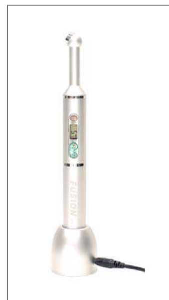
Das zantomed Dentlight verfügt über Eigenschaften wie eine Plasmalampe – mit Ausnahme des Preises.

Die Polymerisationslampe deckt ein Lichtspektrum von 390 bis 490 nm ab und