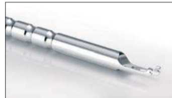
Mithilfe des neuen Quick®-Bogeninstruments lassen sich Bögen noch einfacher und schneller in den Bracketslot einlegen.

möglicht dem Anwender, Bögen künftig noch sicherer bei schwierigen Situationen, wie z. B. stark verlagerten Eckzähnen oder stark rotierten Zähnen, in den Bracketslot einzulegen. Doch nicht nur die brandneuen Innovationen stießen am FORESTADENT-Stand auf großes Interesse. So sorgte u. a. das extrem flache 2D®-Lingualbracketsystem für rege Nachfragen. Auch der Functional Mandibular Advancer (FMA) zur compliance-unabhängigen Korrektur von Klasse II-Anomalien war Mittelpunkt zahlreicher Standgespräche.