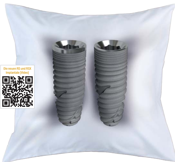
Abb. 2: Die dreimonatige BEGO-Werbekampagne „Schwangerschaft“ erreicht mit der Geburt der Zwillinge seinen Höhepunkt.

Frau Dr. Chuchracky: Neben einer Version mit maschinierter Schulter wird eine Version mit komplett strukturierter Schulter angeboten. Hiermit bieten wir dem Behandler je nach den patientenindividuellen Bedürfnissen und eigenen Präferenzen die Möglichkeit der Wahl. Beide Systeme verfügen des Weiteren über ein Platform-Switch. Das Design der Schneidnuten ist so gestaltet, dass ein möglichst optimaler, weil langer, Knochenspan entsteht. Knochenspäne werden über die Schneidnut nach krestal befördert und sorgen für