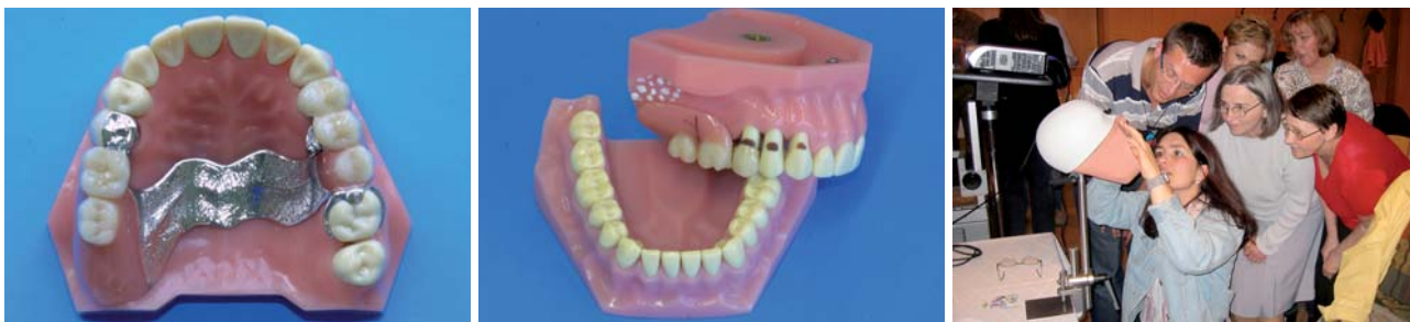
Abb. 7a und b: Das entwickelte Demonstrationsmodell zeigt Konstruktionselemente von Prothesen und typische Pathologien (Pilz, Karies, Druckstelle sowie Prothesensprung, Verblendabplatzung). – Abb. 8: Die Montage im Phantomkopf schließlich erlaubt eine praxisnahe Schulung zum Ein- und Ausgliedern von Zahnersatz sowie die Inspektion der Mundhöhle.