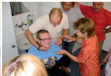
Abb. 4: Im Internet gibt der Praxisführer Auskunft, wo pflegebedürftige Menschen zahnärztlich behandelt werden können. – Abb. 5a und b: Schulungen auch mit praktischen Übungen stoßen bei Pflegekräften auf sehr großes Interesse.

Die Mundgesundheitsförderung durch konsequente Schulungen der Pflegekräfte und durch kompetente zahnärztliche Betreuung vor Ort. So konnten Beläge und Zahnfleischentzündungen nach vier, acht und zwölf Monaten stetig verbessert werden. 82 % der Studienteilnehmer wiesen eine saubere Zunge auf; 26 % waren es bei der Basisuntersuchung, und nur noch 10 % der Prothesen waren zum Zeitpunkt der letzten Stichprobe völlig belegt (55,6 % bei der Basisuntersuchung). 11