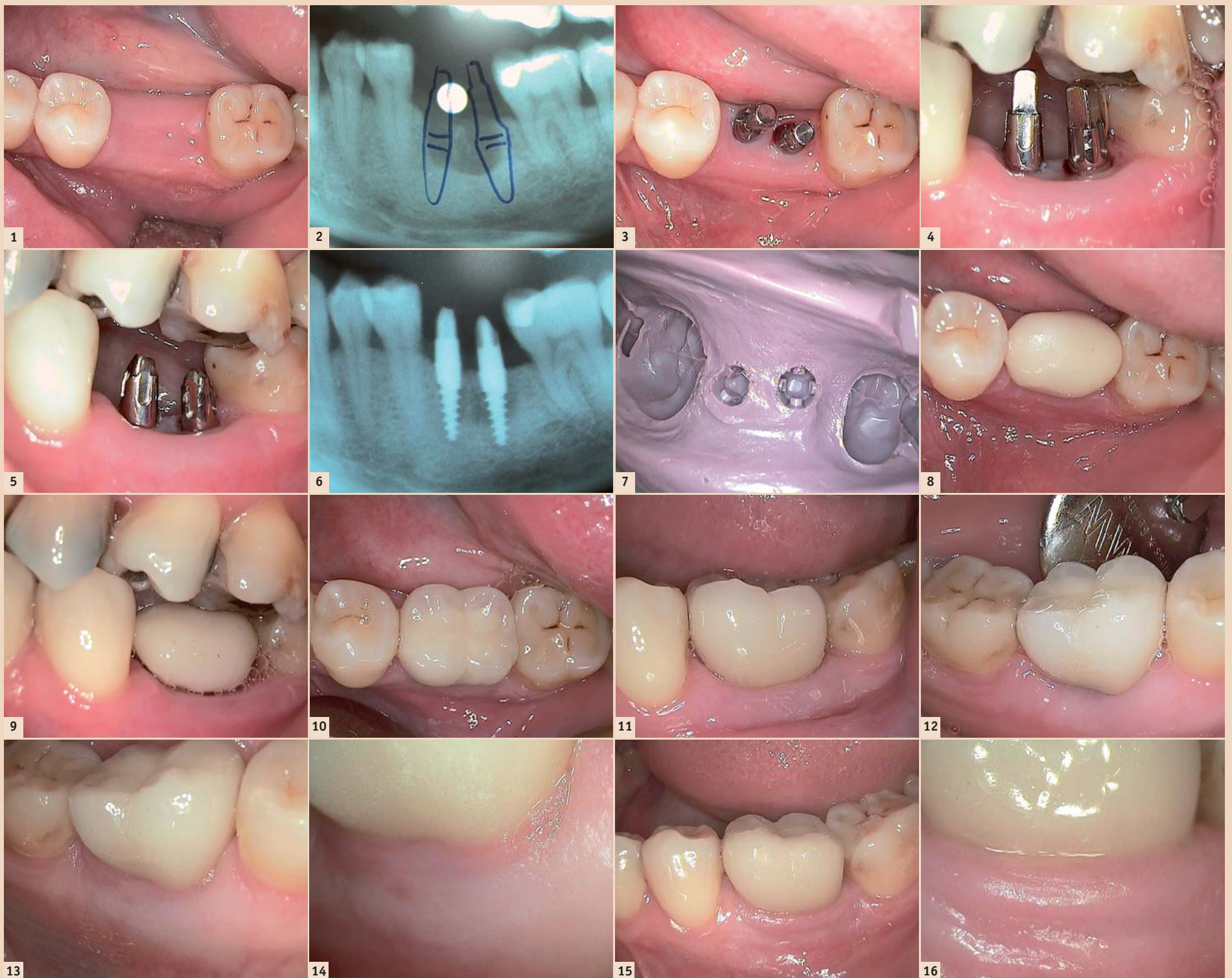
Abb. 1: Klinische Ausgangssituation. – Abb. 2: OPG. – Abb. 3: Zwei Champions-Implantate sind inseriert (Ansicht von okklusal). – Abb. 4: Zwei Champions-Implantate sind inseriert (Ansicht von vestibulär). – Abb. 5: Präparation der Implantate. – Abb. 6: Kontroll-OPG. – Abb. 7: Abformung mit Impregum. – Abb. 8: Provisorische Krone (Ansicht von okklusal). – Abb. 9: Provisorische Krone (Ansicht von vestibulär). – Abb. 10: Definitive Zirkondioxidkrone (Ansicht von okklusal). – Abb. 11: Definitive Zirkondioxidkrone (Ansicht von vestibulär). – Abb. 12: Definitive Zirkondioxidkrone (Ansicht von lingual). – Abb. 13: Ansicht von lingual nach zwei Jahren ... – Abb. 14: ... mit Makroaufnahme. – Abb. 15: Ansicht von vestibulär nach zwei Jahren ... – Abb. 16: ... mit Makroaufnahme.

fortversorgung gegenüber der Überlebensrate nach konventionellen Einheitszeiten unterlegen ist. Auch bei histologischen Untersuchungen konnte Degidi et al. 3 feststellen, dass sowohl bei konventionell inserierten Implantaten als auch bei sofortbelasteten Dentalimplantaten nach vier und acht Wochen hohe Knochen-Implantat-Kontakte nachweisbar waren. Einen weiteren Beleg für die Möglichkeit der hier beschriebenen Vorgehensweise lieferten Ioannidou und Doufexi. 4 Sie zeigten in ihrer Metaanalyse von 13 prospektiven Studien noch einmal auf, dass bei einer Frühbelastung, wie in unserem Fall, keine schlechteren Ergebnisse, verglichen mit konventionellen Belastungszeiten, festzustellen sind. Nach den Ergebnissen der Literaturanalyse ist es heute nicht mehr angefechtbar, dass Implantate erfolgreich