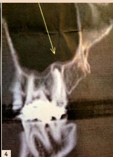
Abb. 1: Ohrreflexzonen. – Abb. 2: Nadeln in Ohrreflexzonen. – Abb. 3: Röntgenbefund 27. – Abb. 4: CT-Befund bei 27.