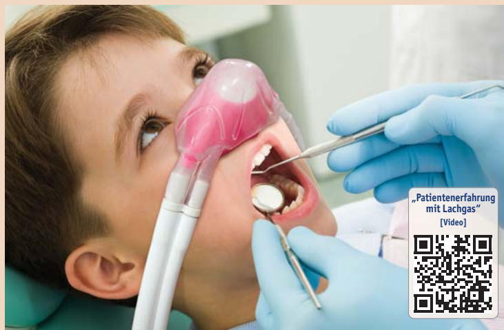
sedaview® – die einzigartige Doppelmaske von BIEWER medical.

Die Lachgassedierung ist die sicherste Form der zahnärztlichen Sedierung und die orale Sedierung ist einfach in der Anwendung. Die Wirkung setzt bei Lachgas sehr schnell ein, der Patient ist entspannt und weniger ängstlich, bleibt aber die ganze Zeit ansprechbar. Nimmt der Zahnarzt die orale Sedierung hinzu,