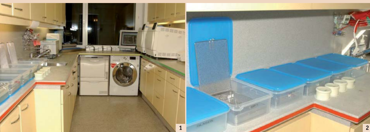
Abb. 1: Sterilisationsraum mit farblich gekennzeichneten Hygienezonen: rot, gelb, grün. – Abb. 2: Desinfektionsbadwannen mit Reinigungsinstrumentenbehälter mit Deckel.