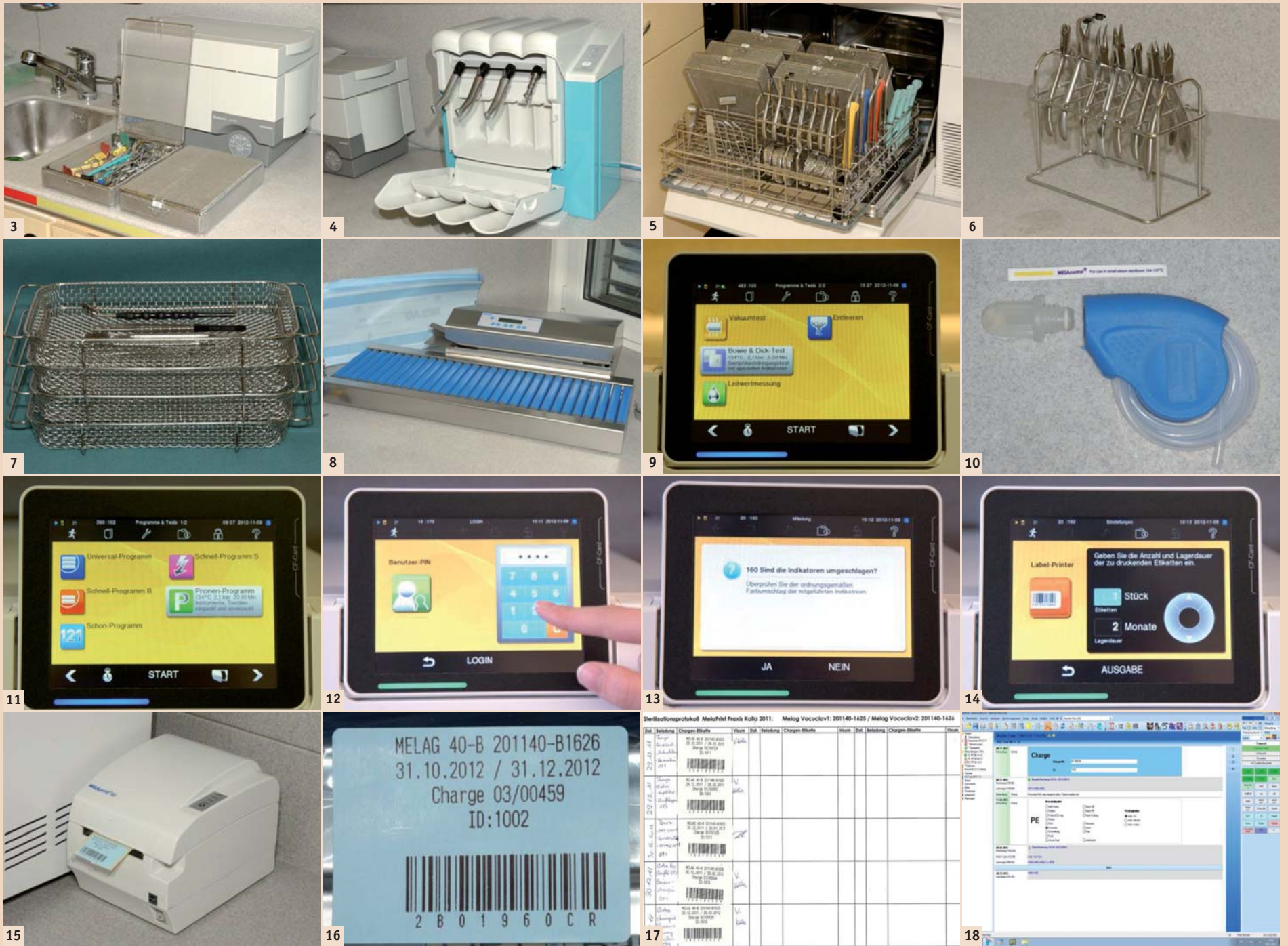
Abb. 3: Reinigungs-Instrumentenbehälter mit Deckel vor Ultraschallbad (COLTENE: Biosonic UC100 für Einzelinstrumente und UC300 für Kassetten/Körbe). – Abb. 4: Pflege- und Reinigungssystem für Winkelstücke (KaVo: QUATTROcare). – Abb. 5: Haltesystem für Saugkanülen: Reinigung von innen und außen. – Abb. 6: Reinigungs-Haltesystem für Zangen für Ultraschall und Thermodesinfektor. – Abb. 7: Offene, stapelbare Instrumentenkörbe. – Abb. 8: Folienbeutel-Schweißsystem (MELAG: MELAseal Pro). – Abb. 9: Prüfprogramme am Autoklaven (MELAG Vacuclav 40B+). – Abb. 10: Prüfkörper für den „Bowie & Dick-Test“. – Abb. 11: Touchscreen am Autoklaven für die Dateneingabe: Programmwahl für die manuelle Dateneingabe und Anzeige der jeweiligen Traybestückungen. – Abb. 12: Eingabe des persönlichen Identifikationscodes. – Abb. 13: Bestätigen des Farbumschlages des Indikators. – Abb. 14: Eingabe der Etikettendaten. – Abb. 15: Etikettendrucker MELAprint 60. – Abb. 16: Chargen-Einfach-Klebeetiketten (blau). – Abb. 17: Manuelle Beladungsliste mit Chargenetiketten. – Abb. 18: Chargendaten in der elektronischen Krankengeschichte (Beispiel: ZaWin4).