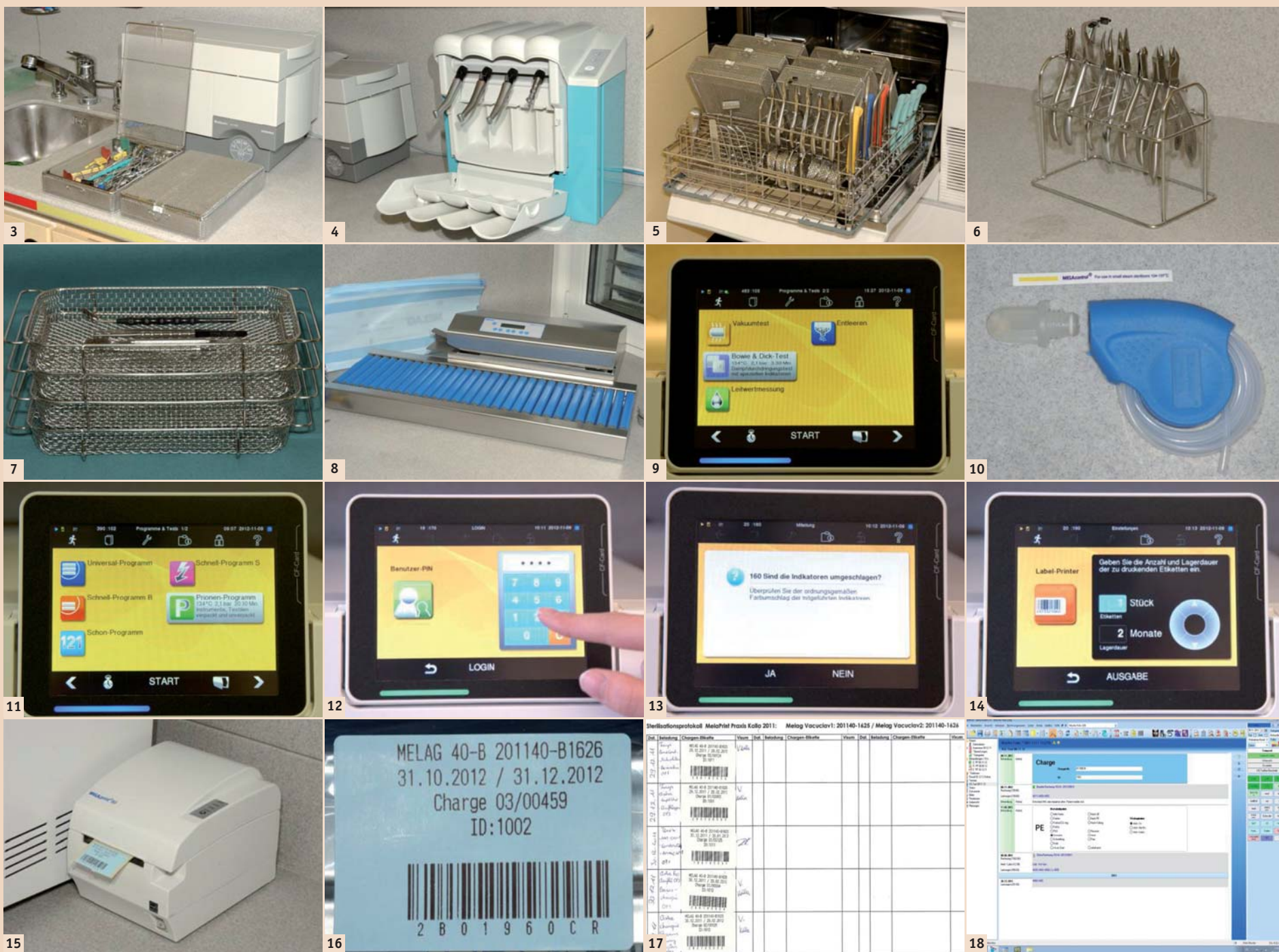
Abb. 3: Reinigungs-Instrumentenbehälter mit Deckel vor Ultraschallbad (COLTENE: Biosonic UC100 für Einzelinstrumente und UC300 für Kassetten/Körbe). – Abb. 4: Pflege- und Reinigungssystem für Winkelstücke (KaVo: QUATTROcare). – Abb. 5: Haltesystem für Saugkanülen: Reinigung von innen und außen. – Abb. 6: Reinigungs-Haltesystem für Zangen für Ultraschall und Thermodesinfektor. – Abb. 7: Offene, stapelbare Instrumentenkörbe. – Abb. 8: Folienbeutel-Schweißsystem (MELAG: MELAseal Pro). – Abb. 9: Prüfprogramme am Autoklaven (MELAG Vacuclav 40B+). – Abb. 10: Prüfkörper für den „Bowie & Dick-Test“. – Abb. 11: Touchscreen am Autoklaven für die Dateneingabe: Programmwahl für die manuelle Dateneingabe und Anzeige der jeweiligen Traybestückungen. – Abb. 12: Eingabe des persönlichen Identifikationscodes. – Abb. 13: Bestätigen des Farbumschlages des Indikators. – Abb. 14: Eingabe der Etikettendaten. – Abb. 15: Etikettendrucker MELAprint 60. – Abb. 16: Chargen-Einfach-Klebeetiketten (blau). – Abb. 17: Manuelle Beladungsliste mit Chargenetiketten. – Abb. 18: Chargendaten in der elektronischen Krankengeschichte (Beispiel: ZaWin4).