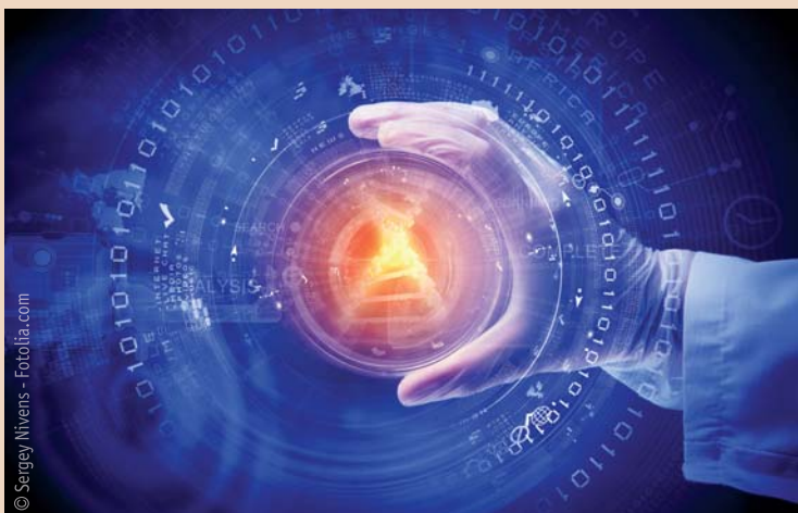
Die Zellen sollen so „programmiert“ werden, dass sie gezielt Knochengewebe aufbauen.